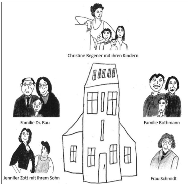
Übersicht 1: „Was ist denn hier bei uns im Haus los?“

Die entwickelte Sozialstudie folgt der didaktischen Intention, die sozialen Unterschiede und Ungleichheiten innerhalb unserer Gesellschaft exemplarisch an diesem Haus und seinen Bewohnern zu untersuchen. Die sozialen Unterschiede zwischen den Hausbewohnern sollen dabei nicht allein materiell über ihr Einkommen und ihren Beruf, sondern auch über ihre milieubezogenen Lebensstile und ihre Lebenseinstellungen erfasst werden. Das ist wichtig, weil in unserer Gesellschaft Teilhabechancen und Abgrenzungsmechanismen eben auch über milieuspezifische Lebensstile und Habitusformen bestimmt werden. Für die Lernenden ergibt sich auf diese Weise die Möglich-