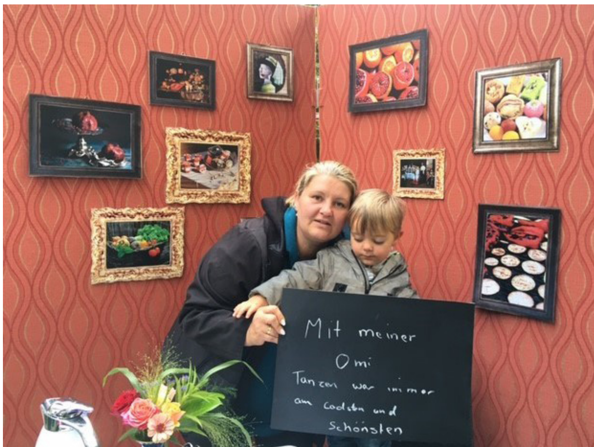
Bild aus der Aktion Wohnzimmergespräche „Familienfeiern“

Für das Zusammenleben in der Siedlung und auch für den Mikroraum des Bürgerhauses ist vor allem die Erfahrung der eigenen Selbstwirksamkeit zu nennen, da biografische Erzählungen Einzelner gezeigt wurden und diese so Wertschätzung erfahren haben. Dies wurde auch von einigen Teilnehmenden bezüglich ihrer Exponate in den Beziehungskisten so benannt. Die Motivation war