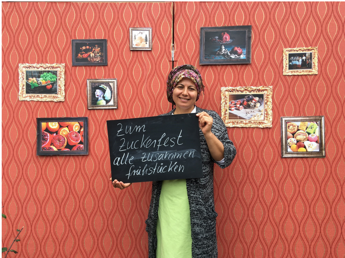
Bild aus der Aktion Wohnzimmergespräche „Familienfeiern“

es der Wiederholung und damit Intensivierung bedarf, um die Bewohner*innen der Lenzsiedlung so anzusprechen, dass sie auch tatsächlich an Aktionen teilnehmen. Dies konnte leider aufgrund der wechselnden Rahmenbedingungen durch die Covid 19-Pandemie und die auf vier Jahre begrenzte Laufzeit des Projekts nicht erprobt und ausgewertet werden.