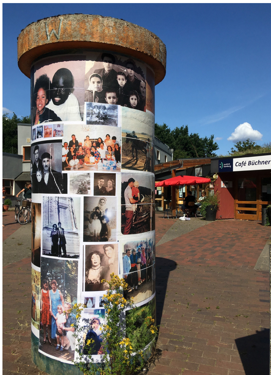
Familienbilder im öffentlichen Raum vor dem Bürgerhaus

„Wir [die Erzählende und ihre Tochter, Anm. der Autorinnen] haben immer zusammen Schreibübungen mit dem Heft gemacht. Es gefällt mir, es auszustellen, damit andere Menschen sehen, wie Bangla [südasiatische Sprache mit eigener Schrift, Anm. der Autorinnen] aussieht und geschrieben wird. Und wer Lust hat zu üben, probiert es gerne aus!“ (Die Teilnehmende hatte zu dem Heft einen Stift gelegt, damit Betrachter*innen Schreibübungen machen konnten.)