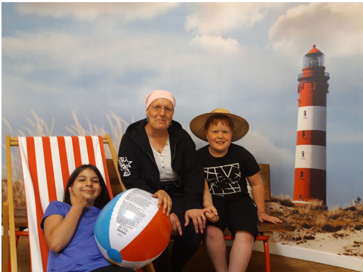
Bild aus der Aktion Fotoreisen „Urlaub vom Alltag“