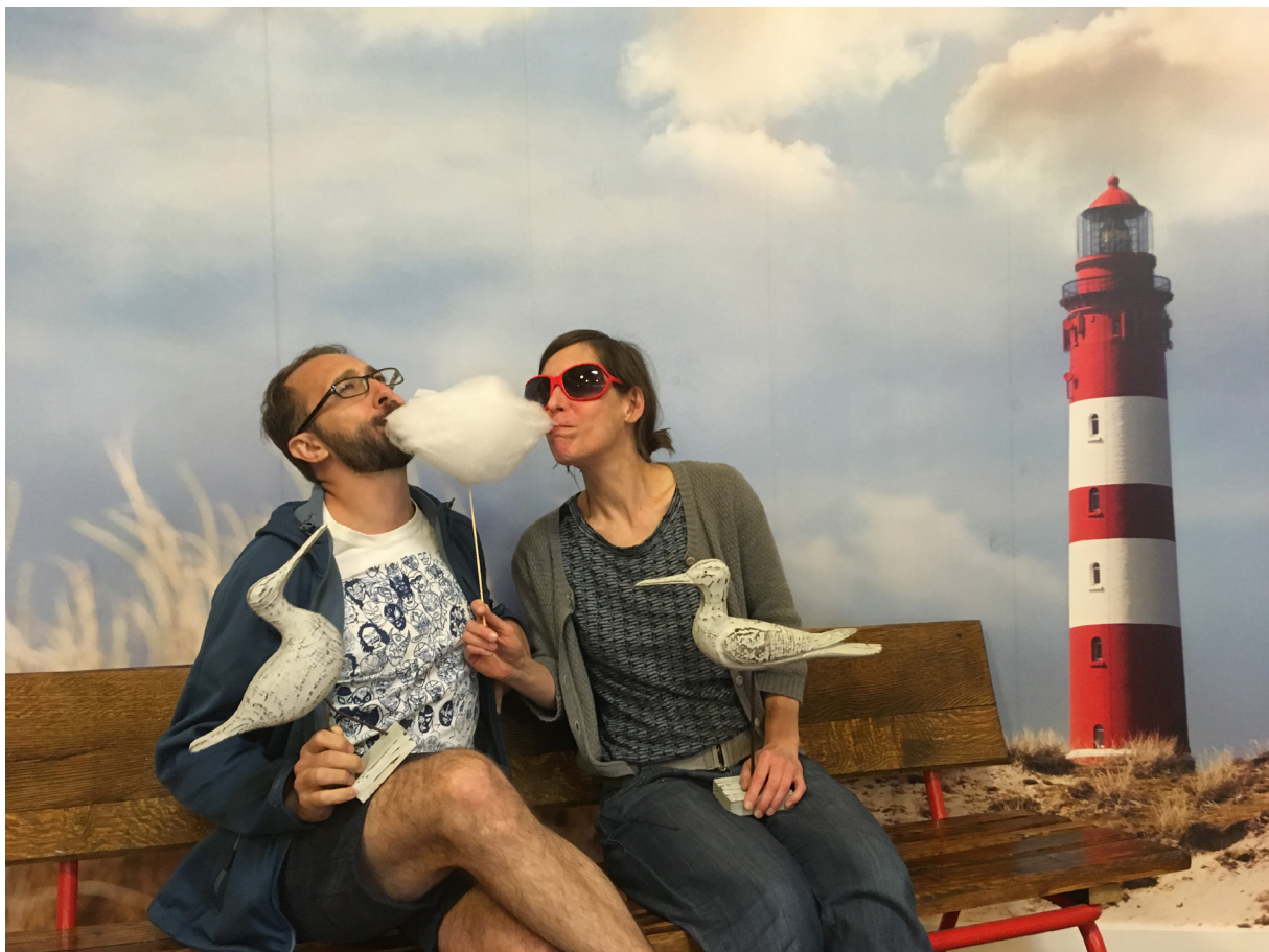
Bild aus der Aktion Fotoreise „Urlaub vom Alltag“

Bei allen beschriebenen Aktionen waren die Teilnehmer*innen eingeladen, ihre Geschichte zu erzählen und sich in Szene zu setzen. Dabei sind die Aspekte des sich Öffnens, der Selbstdarstellung und der Sichtbarkeit eng miteinander verwoben. Wie Annette Abel zusammenfasst, „geht es [bei allem] immer darum, dass man die Tür ein kleines bisschen aufmacht und etwas von sich zeigt, was Leute sonst gar nicht wissen können“. Dabei entschieden die Teilnehmenden bewusst selbst, was sie zeigen oder mitteilen wollten. Auf das Bild des „Tür-Aufmachens“ Bezug nehmend stellten sich für uns folgende Fragen als besonders interessant heraus: Wie weit wird die Tür aufgemacht (sich Öffnen)? Wer wird überhaupt hineingelassen (Sichtbarkeit)? Welche Ecken werden mit welchem Licht ausgeleuchtet (Selbstdarstellung)?