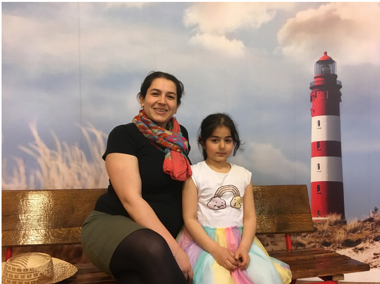
Bild aus der Aktion Fotoreisen „Urlaub vom Alltag“

Alle beschriebenen Vorgehensweisen weisen darauf hin, dass der Beteiligung von Bewohner*innen sowie deren Austausch untereinander komplexe Mechanismen zugrunde liegen. Beteiligungsorientierung für die Bewohner*innen zu gewährleisten, kann nur bedeuten, dass die Organisator*innen von Aktionen ihr Handeln und die Gestaltung der Aktionen stetig überdenken und ggf. anpassen sollten, um möglichst vielen Personen ihrem Interesse und ihren Fähigkeiten entsprechend eine Beteiligung zu erleichtern.