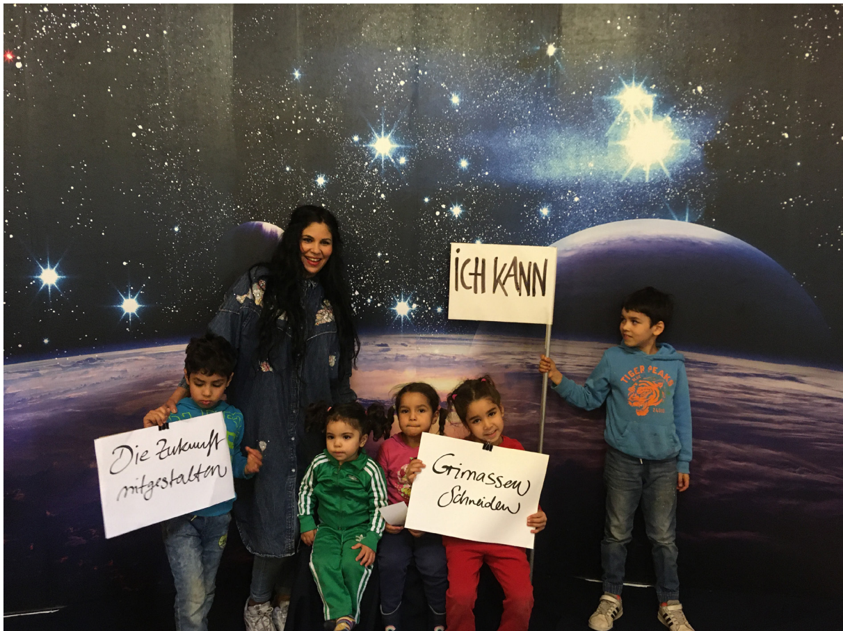
Bild aus der Aktion Fotoreise „Meine Ziele, meine Stärken“

Über die Bedeutung der Aktionen für die*den Einzelne*n hinaus können alle Aktionen im Hinblick auf das Gemeinwesen betrachtet werden. Alle Aktionen verfolgten auch das Ziel, das Gemeinwesen in der Lenzsiedlung zu stärken, indem Begegnungssituationen im (halb-)öffentlichen Raum geschaffen wurden. Durch den Austausch untereinander konnten nachbarschaftliche Beziehungen gestärkt werden, was wiederum Bedingungen schafft, die das Zusammenleben erleichtern können.