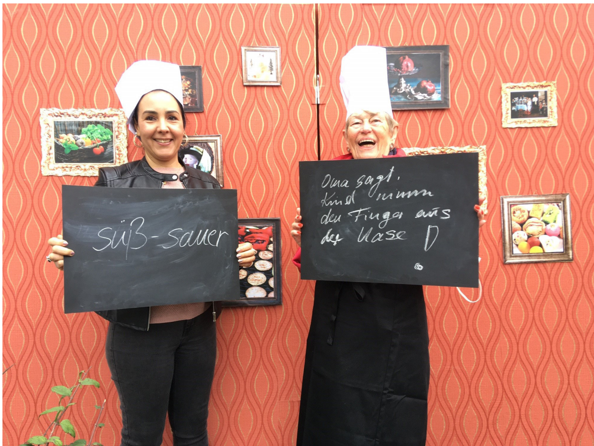
Bild aus der Aktion Wohnzimmergespräche „Familienfeiern“

Während der Aktionen war es für die Durchführenden immer wieder spannend und überraschend, wie sehr die Teilnehmenden sich öffneten, freimütig über sich und ihre Familien berichteten und damit persönliche, biografische oder familiäre Aspekte offenlegten. Dies trifft besonders auf die Familienbilder und die Wohnzimmergespräche zu, die beide Bezug auf konkrete Anlässe bzw. Punkte in der Biografie nahmen, an die sich die meisten Personen erinnern konnten und die somit Erinnerungsfenster öffneten. Hinzu kam, dass der persönliche Dialog über Erlebnisse ausreichend Zeit einräumte, Erinnerungen zu reaktivieren und nach und nach ans Licht zu bringen.