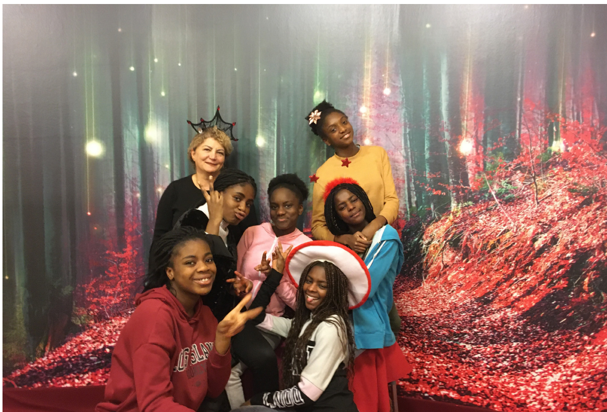
Bild aus der Aktion Fotoreisen „Meine Wünsche“

des Lenzsiedlung e. V., das dementsprechend auch niemanden „unter den Nägeln brannte“, also nicht an persönlicher Betroffenheit andockte. Hinzu kommt, dass die Klientel des Lenzsiedlung e. V. grundsätzlich eher als konsumierend und weniger als mitgestaltend oder selbstorganisiert bezeichnet werden kann, wie in Gesprächen mit langjährigen Mitarbeiter*innen des Lenzsiedlung e. V. immer wieder deutlich wurde. Hierfür könnte es unserer Meinung nach zwei Erklärungsansätze geben. Zum einen bestehen Kontakte und Verbundenheit zum Lenzsiedlung e. V. und dessen Angebot vielfach über die Beratung, was darauf verweist, dass es bei den Nutzer*innen immer wieder Lebensbereiche gibt, die mit Schwierigkeiten und Stress belegt sind. Es scheint daher nicht ungewöhnlich, dass die Attraktivität vieler im Freizeitbereich angesiedelter Angebote des Lenzsiedlung e. V. an den Umstand gekoppelt ist, mal nichts machen, sich um nichts kümmern zu müssen. Zum anderen ergaben erste Erfahrungen mit unterschiedlichen Aktionsformen im Rahmen von POMIKU, dass schon die Eigenbestimmung der Wertigkeit oder auch der Daseinsberechtigung von Exponaten in einer Ausstellung sowie die Gestaltung der Exponate vielen Teilnehmenden schwerfiel, auch wenn es im Laufe der Zeit positiv aufgenommen wurde. Dies verweist u.U. auch auf wenig Erfahrung in Bezug auf in der Öffentlichkeit sichtbare Mitentscheidung/Mitbestimmung und dementsprechend geringes Zutrauen in die eigenen Kompetenzen diesbezüglich.