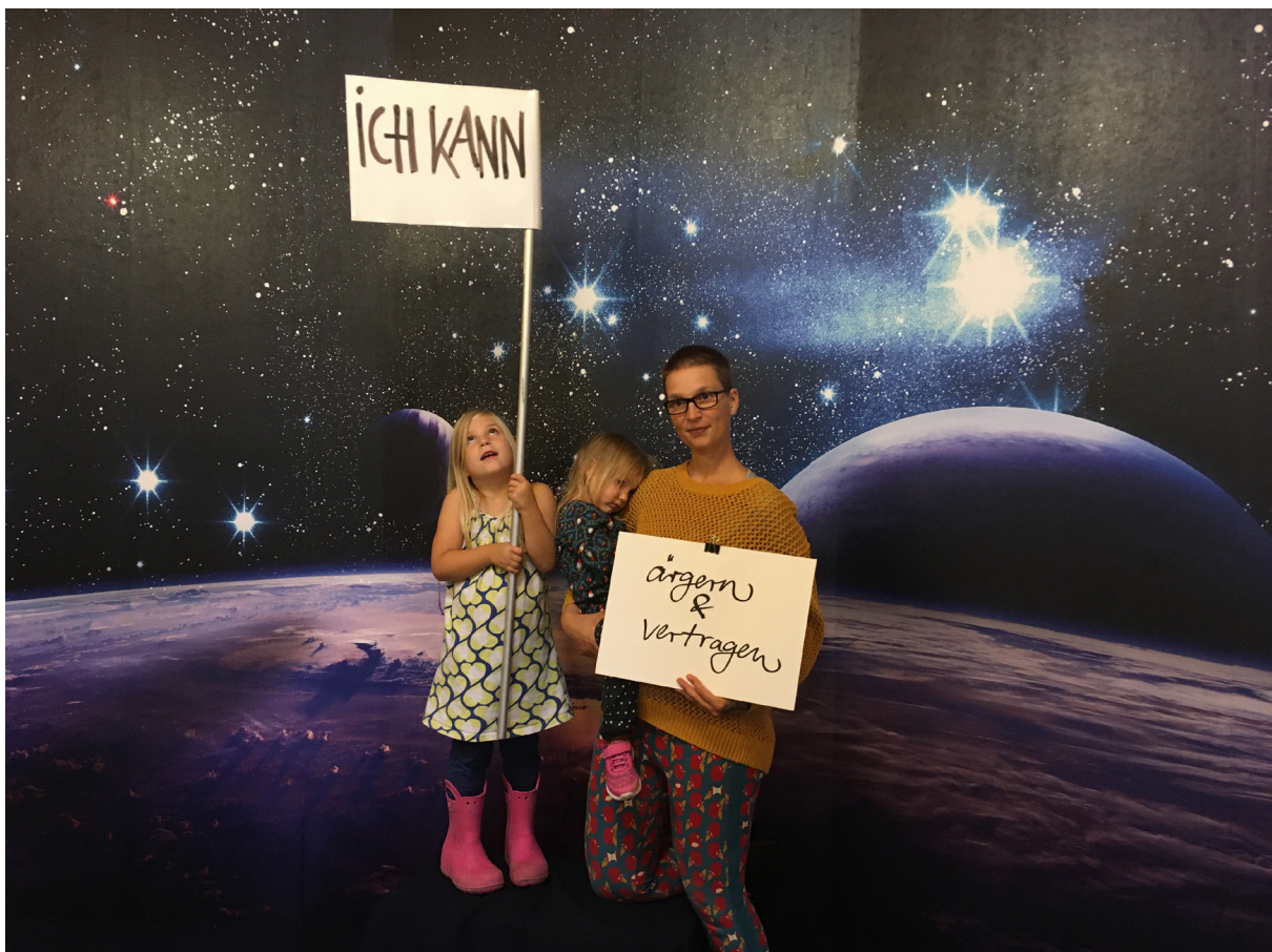
Bild aus der Aktion Fotoreise „Meine Ziele, meine Stärken“

Aktuelle Fotografien der eigenen Person, wie sie bei den Fotoreisen entstanden sind, suggerieren einen hohen Grad der Selbstdarstellung, da sie sofort zuzuordnen sind. Doch auch die Familienbilder mit oftmals alten Aufnahmen der Person oder anderen Familienmitgliedern sowie die Objekte der Beziehungskisten funktionieren ähnlich, insbesondere durch die hinter den Fotografien und Objekten steckenden vertonten oder schriftlich festgehaltenen Geschichten. Auch wenn die Objekte und Familienbilder erst einmal für sich stehen und anonym wirken, inszenieren sie doch in Kombination mit der zugehörigen Geschichte ein biografisches Erlebnis oder die Beziehung zu einer anderen Person.