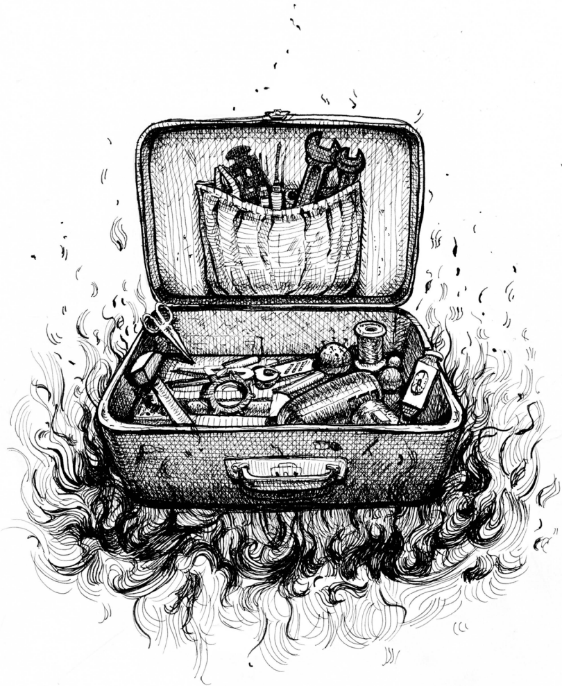
Illustration: Krystin Unverzagt