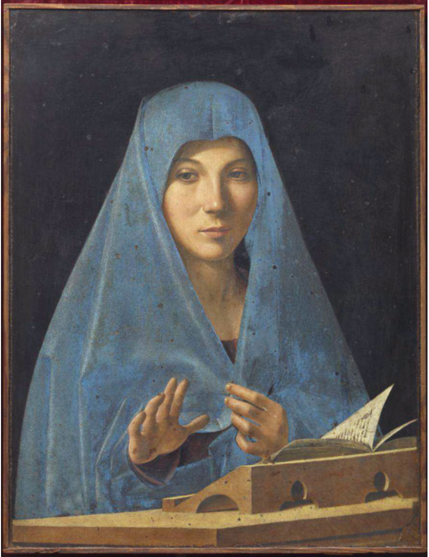
Abbildung 1: Antonello da Messina: Annunziata.