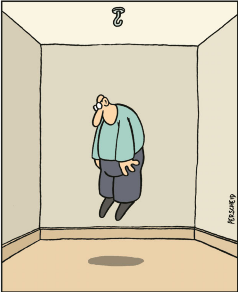
Abbildung 2: Schema der Funktionsweise des Humors

NUR WENIGE WISSEN, DASS DER ERFINDER DES SCHNURLOSEN TELEFONS SELBSTMORD BEGING.