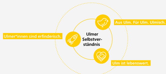
Abbildung 4: Vision und Mission in der Smart City Strategie Ulm, Quelle: Stadt Ulm o.J.

Sie soll die Akteure aus Stadt, Zivilgesellschaft, Wirtschaft und Wissenschaft anregen und motivieren gemeinsam mit uns die digitale Stadt Ulm zu gestalten.