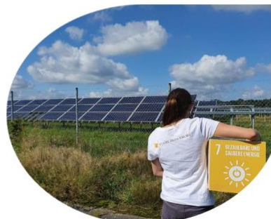
Abbildung 17: Beschreibung von Handlungsfeldern im Nachhaltigkeitsleitbild der Stadt Oldenburg, Beispiel, Quelle: Stadt Oldenburg 2022, S. 16.

Der Leitbildprozess habe bislang wichtige Diskussionen zum Verständnis des Nachhaltigkeitsbegriffs und den Möglichkeiten zur Umsetzung von Nachhaltigkeitszielen