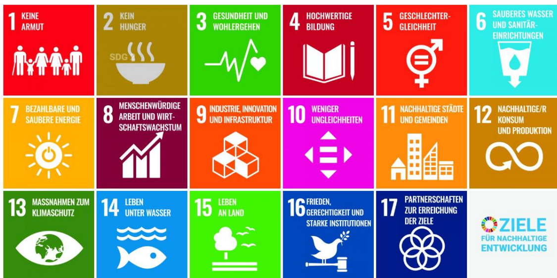
Abbildung 1: Die 17 Sustainable Development Goals der UN, Quelle: https://un-ric.org/de/17ziele/ .

Ähnlich wie bei den Digitalisierungsstrategien ist die kaskadische Entwicklung von Strategien als Versuch der Steuerung von Kommunen im Bereich freiwilliger Leistungen zu sehen. Als Trägern wesentlicher Leistungen der Daseinsvorsorge kommt den Kommunen eine wesentliche Verantwortung für die Implementierung von Nachhaltigkeitszielen zu. 60 Die Entwicklung konzeptioneller Dokumente im Sinne von „Leitlinien“ oder „Strategien“ ist ein zentraler Bestandteil der Handlungsempfehlungen 61 und seit 2015 wurden verschiedene Vorschläge zur Entwicklung und Umsetzung solcher Strategien publiziert. 62 Dabei scheint die Engagement Global gGmbH bzw. die Servicestelle Kommunen in der einen Welt (SKEW) in den letzten Jahren der wesentliche Beratungsakteur für kommunale Nachhaltigkeitsstrategien geworden zu sein. Die SKEW bietet derzeit Programme zur Unterstützung der Erarbeitung von Nachhaltigkeitsstrategien in elf Bundesländern – jeweils mit Bundes- und oder Landesförderung – an. 63 Entsprechend setzt das Vorgehensmodell der SKEW Standards für die Entwicklung von Nachhaltigkeitsstrategien. Die SKEW bietet neben diesen Beratungen zur Entwicklung von Nachhaltigkeitsstrategien (vgl. Abbildung 2), weitere standardisierte Beratungen zu Nachhaltigkeitscontrolling und -reporting sowie Beispiele, Muster und Vorlagen zu SDG-Kennzahlen und Voluntary Local Reviews, 64 sowie Schulungen an. 65 Darüber hinaus stellt das SDG-