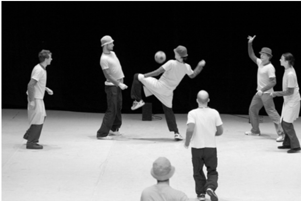
Abb. 1: PROJEKT von Xavier Le Roy

So wird im Moment des Fußballspielens etwas über das Theaterspielen ausgesagt. Es wird darauf verwiesen, dass im Theater als Raum des institutionalisierten Rollenspiels alle Objekte und Handlungen als theatrale Zeichen bereits einen Doppelcharakter haben. Ähnlich wie ein Stuhl auf der Bühne einfach ein Sitzmöbel und zugleich der Platzhalter für einen Königsthron sein kann, lässt sich ein Stolpern über das Tor als Missgeschick eines schlechten Spielers oder aber als kalkulierte Selbstinszenierung eines versierten Darstellers lesen. Hinzu kommt vor dem Hintergrund der Choreographie noch, dass man das Straucheln auch als choreografierte Bewegungsfolge sehen kann.