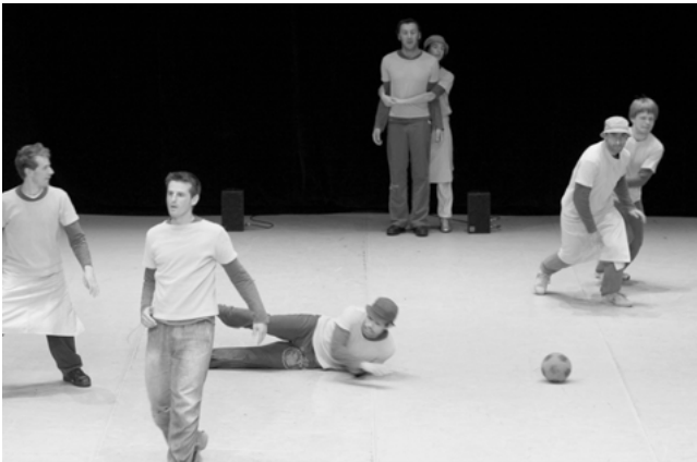
Abb. 3: PROJEKT von Xavier Le Roy

Im nächsten Schritt werden die tanz-/theatralen Parameter Zeit, Musik, Raum und Licht ein- und vorgeführt. Das ›3gg‹ wird verlangsamt, indem jeder Spieler sein Spiel gemäß einer individuellen Interpretation von Langsamkeit fortführt, was es absurd erscheinen lässt, weil die Langsamkeit dem Wettkampfcharakter der Spiele zuwider läuft. Danach wird zu Elektropopmusik gespielt, was dem Spiel einen tänzerischen Rhythmus verleiht. Anschließend wird das ›3gg‹ mit einer körperlich-räumlichen Restriktion gespielt: Die Spieler müssen den Blick ins Publikum richten. Dies hat (neben der Einschränkung des Spielverlaufs) zur Folge, dass das Spielen durch die frontale Ausrichtung zum ersten Mal ganz eindeutig nicht per se , sondern demonstrativ für das Publikum stattfindet.