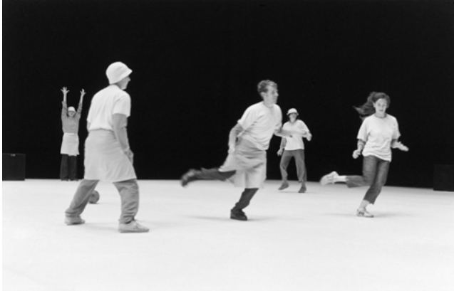
Abb. 6: PROJEKT von Xavier Le Roy

Damit sollte gewährleistet werden, dass die Herausforderungen der Simultaneität, der Komplexität und der Reproduktion der improvisierten Choreographie trotz der zunehmenden Routine bestehen bleiben. Zu große Sicherheit und Spielgewohnheiten sollten vermieden werden, damit jede Aufführung erneut überdacht werden und jedes Spiel neu gespielt werden konnte. Im Sommer 2004 wurde nicht einmal mehr das Spiel trainiert. Stattdessen vergewärtigten sich die Akteure lediglich das Repertoire der Aktionsmöglichkeiten. Gegen Ende der Gastspiele im Sommer 2005 war das Team dann so routiniert, dass es sich dazu entschied, den gesamten Ablauf des Abends vor Beginn der eigentlichen Aufführung einmal rückwärts durchzuspielen, um auch die eingeschliffene Ordnung der Dramaturgie auf den Kopf zu stellen.