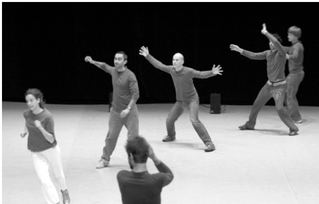
Abb. 4: PROJEKT von Xavier Le Roy

Neben diesen frei, in unterschiedlichen Kombinationen oder mit bestimmten Vorgaben gespielten Spielszenen gibt es in PROJEKT eine sich in unterschiedlichen Varianten wiederholende, ungefähr einminütige Spielsequenz des ›3gg‹. Die Szene wurde ursprünglich live gespielt und auf Video aufgezeichnet. Dann wurden die einzelnen Spielzüge der Original-Spieler von allen Akteuren auswendig gelernt, so dass jeder Akteur ein reichhaltiges Repertoire an ›Rollen‹ und abrufbaren Bewegungsfolgen beherrschte. Das Spiel wurde also im engeren Sinne choreographisch gesetzt. Zu Beginn der Aufführung wird diese Sequenz nach einer kurzen Aufwärm- und Einspielphase, die noch während des Einlasses stattfindet, drei Mal hintereinander (zu Musik, ohne Kostüme und Bälle) vorgeführt, womit sie ganz kurz als sportlich anmutende Choreographie eingeführt wird, die an eine Szene aus Michelangelo Antonionis Film »Blow-Up« (1966) erinnert, in der eine Gruppe von Gauklern auf einem Tennisplatz mit imaginären Schlägern und Bällen Tennis spielt. 50