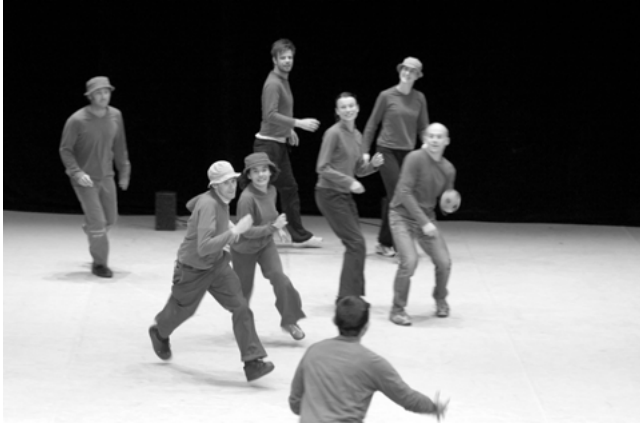
Abb. 5: PROJEKT von Xavier Le Roy

Nach dem Abgang des verbliebenen Spielers folgt ein Moment der Leere, in dem nur noch die Tonspur des von der Bühne verschwundenen Spiels zu hören ist: das Quietschen der Sportschuhe auf dem Tanzboden und die Rufe der Spieler. Schließlich kommen alle Spieler in wild durcheinander gewürfelten Kostümen (dem fünften tanz-/theatralen Parameter) zurück auf die Bühne, um (wie ganz zu Beginn der Aufführung) die einminütige Sequenz erneut dreimal mit Musik und Bällen zu wiederholen. Bei einer Frau im Bademantel mit aufgetragener Gesichtsmaske, einem Spieler im Teddybärkostüm oder einem auf hohen Absätzen stöckelnden Herrn im Abendkleid wird das Spiel vollkommen ad absurdum geführt. Da die Kostüme ein tatsächliches Spielen verhindern, wird der Blick des Publikums auf das kostümierte Theaterspiel gelenkt. So mündet PROJEKT in ein »spektakuläres« Durcheinander, bei dem alle 14 verkleideten Akteure zusammen für eine Runde dieselbe Rolle übernehmen, anschließend ohne Bälle kreuz und quer durcheinander rennen und dabei Kostüme und Rollen tauschen bis schließlich einer von ihnen dem Treiben mit einem letzten, an das Publikum gerichteten »Score« ein Ende setzt. Danach reihen sich alle Spieler wie zuvor für die Demonstration des Punktestands auf, um das Urteil des Publikums in Form eines Applauses entgegenzunehmen.