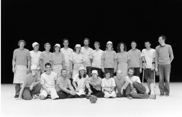
Abb. 7: PROJEKT von Xavier Le Roy

das Spiel mit dem Spiel beibehalten wurde. Eloquenten Sprecher setzten sich mit retrospektiven Definitionen von PROJEKT vor allem in den gemeinsamen Diskussionen innerhalb der Gruppe oder später auch mit dem Publikum durch.