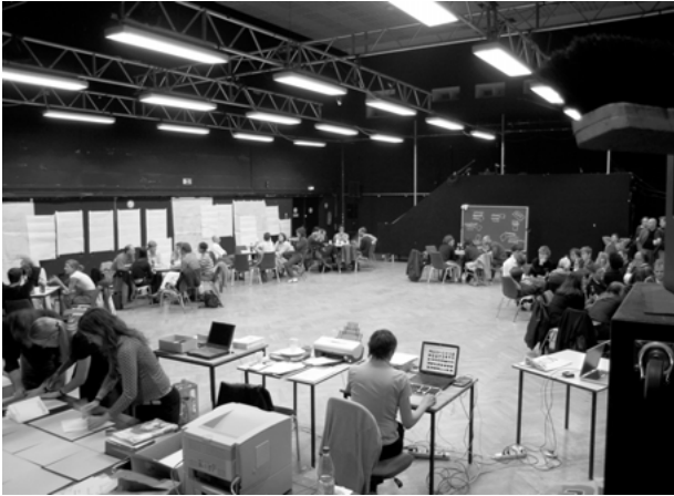
Abb. 8: STATIONEN von Thomas Lehmen

man Kaffee und belegte Brote kaufen kann und einem Pult, an dem der Dramaturg und die Fotografin während der Vorstellung mit der Produktion der Beihefte beschäftigt sind, sitzt das Publikum zusammen mit den Tänzern und »Menschen aus Berufen aller Art« inmitten von Computern, Druckern, Kabeln, Papieren und Zeitungen in einer ungewöhnlichen Aufführungssituation.