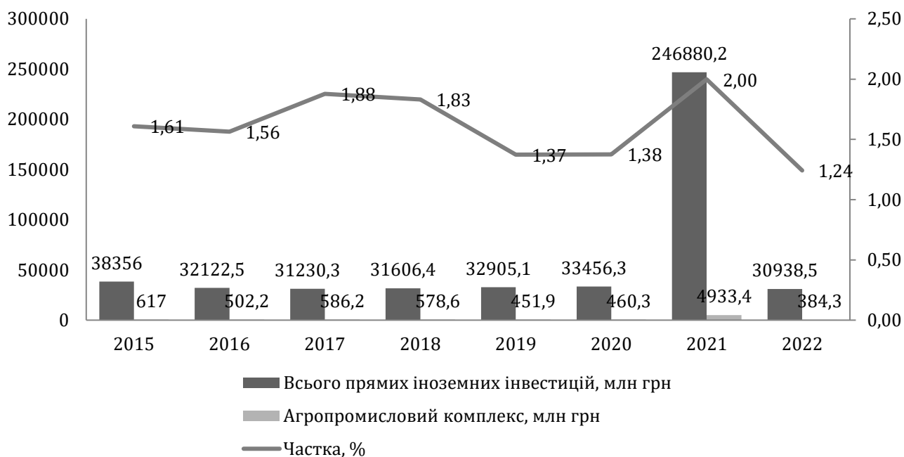
Рисунок 3 – Динаміка прямих іноземних інвестицій в агропромисловий комплекс в Україні за 2015-2022 рр. (систематизовано автором за [7])

Дещо інша тенденція спостерігалася у залученні іноземних інвестицій в агропромисловий комплекс (рисунок 3).