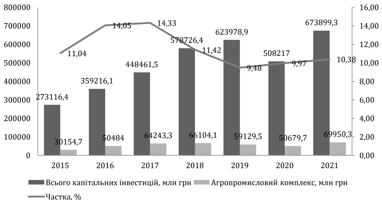
Рисунок 2 – Динаміка капітальних інвестицій в агропромисловий комплекс в Україні за 2015-2021 рр. (систематизовано автором за [7])

Що стосується капітальних інвестицій у агропромисловий сектор, то у 2019 році спостерігалась негативна тенденція стосовно інвестування. На рис. 2 розміщена інформація стосовно капітальних інвестицій протягом 2015-2020 рр. у діяльність агропромислових підприємств.