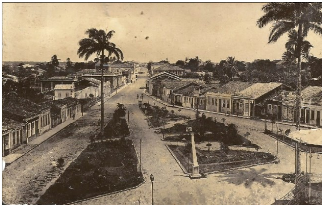
Figura 1 - Vista da Rua Conselheiro Franco, 192[5].