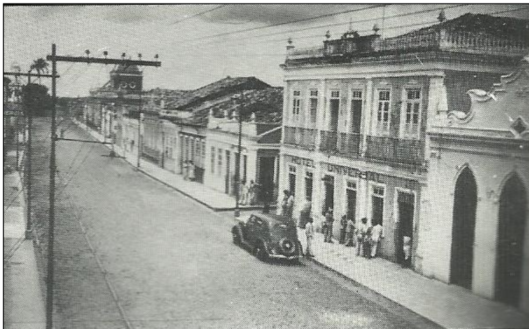
Figura 2 - Vista do Hotel Universal, na Rua Conselheiro Franco, 19[30].