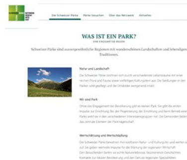
Abbildung 5: Beispiel für eine Prüfungsfrage zum Thema "Qualitative Methoden in der Geographie". Bitte klicken Sie hier oder auf die Abbildung für eine Vergrößerung. 7 [33]

Diese Kombination aus Multiple-Choice - und offener Frage bietet mir die Möglichkeit, sowohl das Wissen über Grundlagen qualitativer Forschung einzuholen als auch dem praktisch orientierten Veranstaltungskonzept Rechnung zu tragen. Dass die Studierenden in der Prüfung einerseits erworbenes Wissen präsentieren und es andererseits im Zuge einer Datenanalyse anwenden müssen, spiegelt den Ablauf innerhalb der Veranstaltung wider. [34]