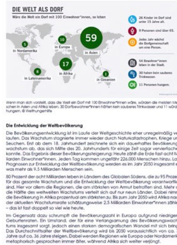
Abbildung 3: Beispiel Analysematerial, Vorlesung "Qualitative Methoden in der Geographie" (Frühlingsemester 2022). Bitte klicken Sie hier oder auf die Abbildung für eine Vergrößerung. 5 [24]

Die Studierenden bilden Gruppen von drei bis vier Personen; sie können sich frei im Hörsaal, der Aula, der großräumigen Cafeteria oder auch sonst im und um das GIUB aufhalten und auch ihre Pausenbedürfnisse selbst wählen. Im Rahmen von 60 Minuten widmen sie sich dem Datenmaterial (Text oder Bild) mittels einer Methode, die sich pro Woche ändert. Meinerseits gibt es keine zusätzlichen Hinweise, wie vorzugehen ist. Ich orientiere mich hierbei an der didaktischen Methode des forschenden Lernens, bei der Suchbewegungen, Umkehrungen, Zirkulationen, Wiederholungen und Neuorientierungen ebenso wie das Scheitern gewünscht sind (MIEG & LEHMANN 2017), da nur so individuelle Strategien im Umgang mit Erfahrungen des Scheiterns entwickelt werden können. [25]