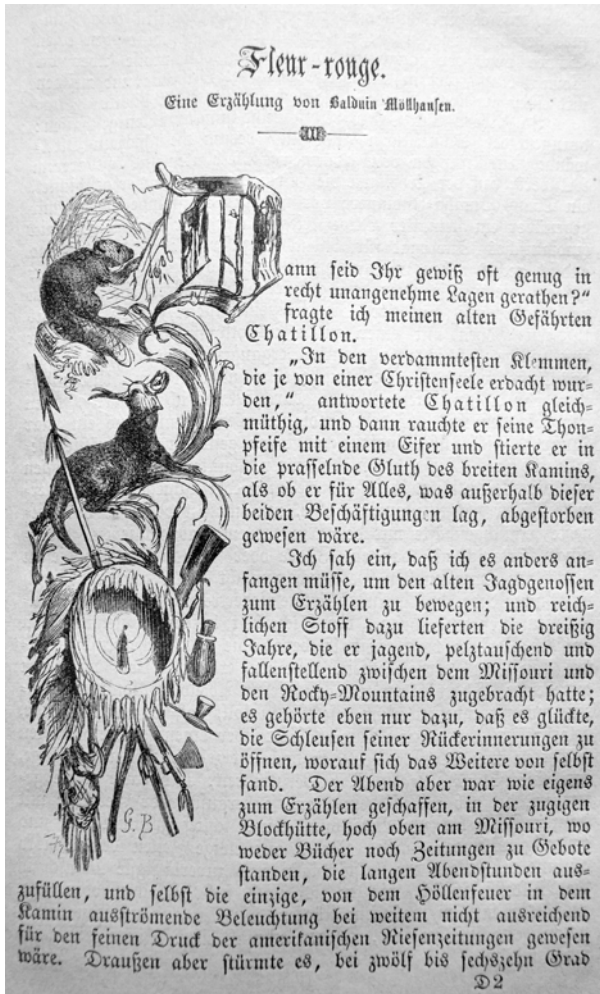
Illustration von »G.B.« in Trowitzsch's Volkskalender, Jg. 43, 1870, S. 51.

Indianer gerichtet, der Rahmenerzähler begutachtet Chatillon mit einem seitlichen Blick und die Augen des Ottoes scheinen geschlossen zu sein.