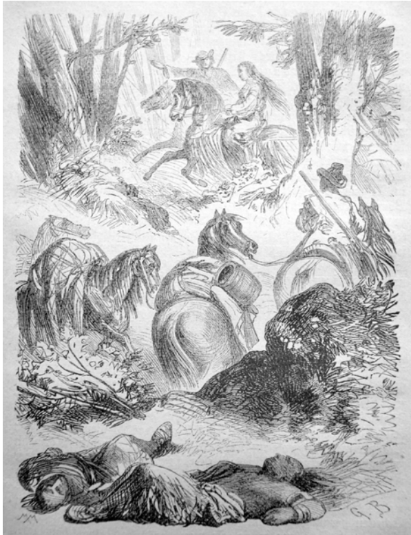
Illustration von »G.B.« in Trowitzsch's Volkskalender , Jg. 43, 1870, S. 77.

etwa Grewling, einen »idyllic ideal type of German colonialism: through the voluntary submission of the native woman, the white man gains legitimate access to the foreign land« (Grewling 152). Deutlichster Ausdruck der Kolonialfantasie ist dabei die Ehe zwischen dem Trapper und der Indianerin. Die Gründung einer sogenannten »inter-racial family« (Grewling 173) ist laut Grewling ein häufiges Motiv in Möllhausens Werk und versinnbildlicht ein harmonisches Lösungsmodell für die Rassen- und Territorialkonflikte, das allerdings nur dann zu funktionieren scheint, wenn sich die indianische Frau dem Werte- und Kultursystem des weißen Mannes anpasst (vgl. Grewling 155-75). Auch wenn Chatillons Identität als durchaus »hybrid« beschrieben wird, da er etwa »indianische[] Gamaschen und Mokassins« (5) trägt, deuten die Charakterisierung Fleur-rouges und der kolonialistische Ton des