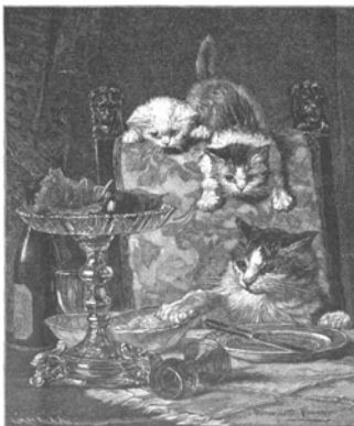
Katzenhüterin. Nach dem Originalde von Henriette Hammer.

„Wird nicht so. Was weist Du davon? Ihr habt ja gar keine Religion. Und Cecelia eigentlich auch nicht. Aber er ist ein guter Mann, eine Seele von Mann, und