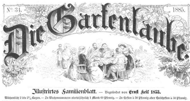
Abb. 1: Titelblatt des 34. Heftes der Gartenlaube von 1885