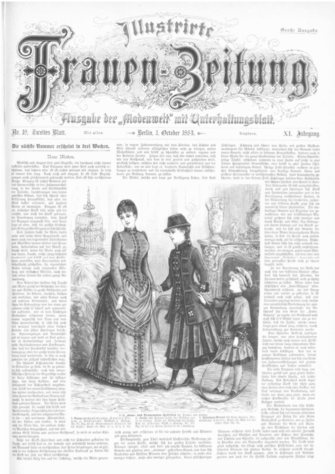
Titelseite. Illustrirte Frauen-Zeitung. Ausgabe der »Modenwelt« mit Unterhaltungsblatt, Jg. 11, H. 19, Zweites Blatt, 1884, S. 145.

Kontrast steht. Denn der Knabe ist mit einem Reifen abgebildet, der auf sportliche Aktivität verweist und hält zudem – energisch nach vorn blickend – den zur Bewegung des Reifens verwendeten Stock in der Hand. In dieser bestimmten Haltung und dazu mit einem phallischen Gegenstand, der einem Taktstock ähnelt, wirkt er buchstäblich als »Tonangebende« Figur in der Bildkomposition. Handlungsfähigkeit und Beweglichkeit liegen damit beim männlichen Teil der Figurenkonstellati-