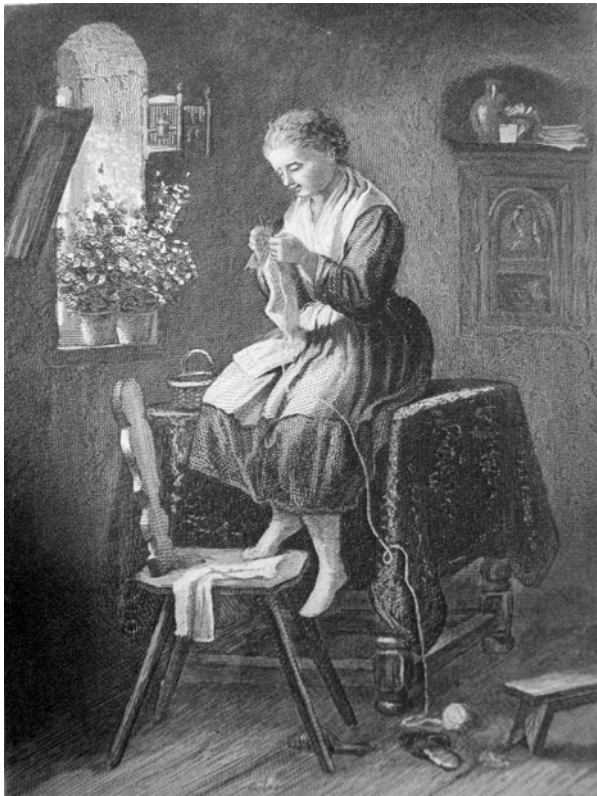
Meyer von Bremen. »Die letzte Masche«. Trowitzsch's Volkskalender , Jg. 43, 1870, Titelei.

städtischen, bürgerlichen Publikum weit verbreitet war und von dem Bedürfnis nach einer Kontinuitätsvergewisserung angesichts der rasanten Modernisierungsprozesse des späten 19. Jahrhunderts zeugte (vgl. Belgum 144-46).