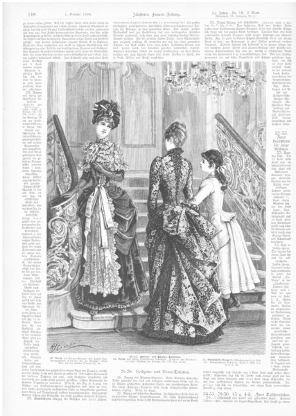
Illustrirte Frauen-Zeitung. Ausgabe der »Modenwelt« mit Unterhaltungsblatt, Jg. 11, H. 19, Zweites Blatt, 1884, S. 148.

die Wiener beschreibt (vgl. Stifter 261-70). 2 Dies zeigt sich auch auf der Ebene des Layouts, in dessen Gestaltung minuziös darauf geachtet wurde, die Seiten lückenlos mit Bildern und Texten auszufüllen, sodass die optische Illusion der Warenwelt durch keine Unterbrechungen gestört ist (vgl. Hörisch 83-143) (Abb. 14).