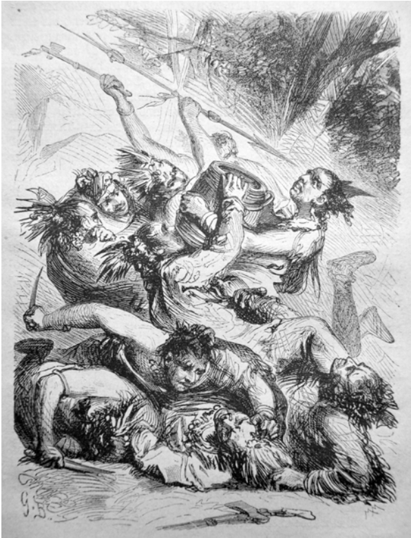
Illustration von »G.B.« in Trowitzsch's Volkskalender, Jg. 43, 1870, S. 75.

der bedient damit zum einen das auf Gewalt und Blutvergießen fixierte Unterhaltungsbedürfnis, das man dem Publikum häufig unterstelle. Zum anderen kommt der Augen-Symbolik eine besondere Signifikanz zu, da Machtstrukturen innerhalb der Erzählung, wie oben dargelegt wurde, optisch codiert sind. Wenn also Chactillon sein besonders gutes Auge Potenz und Stärke verleiht, zeigt der Verlust des Sehens bei diesem Indianer im Umkehrschluss einen Machtverlust auf Seiten der Dacotahs an. Sie erinnern damit an jenen greisen Ottoo-Indianer aus der Rahmenhandlung, dessen Augen geschlossen blieben, sodass er als Objekt der Betrachtung für den sinnierenden Erzähler herhalten konnte. Ebenso verliert der Dacotah in der Illustration gerade die Fähigkeit, Subjekt eines Blickes zu sein, und wird so ausschließlich zum Objekt fremder Blicke.