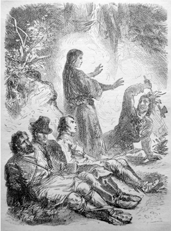
Illustration von »G.B.« in Trowitzsch's Volkskalender , Jg. 43, 1870, S. 73.

sodass das Erzählen in einem melancholischen Ton und mit jener bereits zitierten Endreflexion des Rahmenerzählers ausklingt.