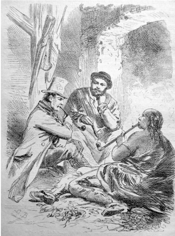
Illustration von »G.B.« in Trowitzsch's Volkskalender, Jg. 43, 1870, S. 53.

len Chatillons. Der Blick des Letzteren fixiert den Ersteren daher wie einen exotischen Gegenstand, der die Erinnerung des Erzählers wachruft. Der Ottoe scheint zwar auf den ersten Blick Teil der Erzählgemeinschaft zu sein, bleibt aber auf die Funktion der Tabakzubereitung beschränkt und steht, da er nach Aussage des Rahmenerzählers ebenfalls keine »fühlende Brust« (5) besitzt, in keinerlei Beziehung zum Erzähler Chatillon oder seiner Geschichte. Ähnlich wie in den Darstellungen »fremder Völker« in illustrierten Zeitschriften oder in den »Völkerschauen« verbleibt der Indianer folglich in der Position des Angeschautwerdens (vgl. Gebhardt 537). Er ist Objekt des imperial gaze und kein »sehendes Subjekt«, worauf seine geschlossenen Augen hinweisen. Die koloniale Machtausübung der Weißen über die Ureinwohnerinnen und Ureinwohner wird hier erneut über Blickregime und das Vi-