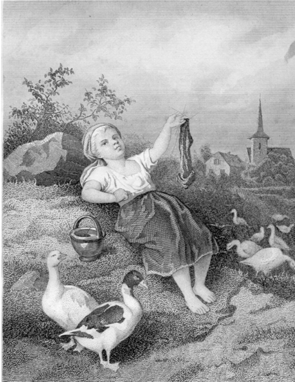
Th. Hosemann. »Der erste Strumpf«. Trowitzsch's Volkskalender , Jg. 45, 1872, Titelei.

3). Auch im obligatorischen Kalenderteil fand sich zu jedem Monat eine kleine Illustration, die eine Szene aus dem bäuerlichen Leben zeigte und zusammen mit saisonalen landwirtschaftlichen Hinweisen den Eindruck »echter Volksnähe« untermauerte, auf den das städtische Publikum Wert legte. Ähnlich wie die illustrierten Zeitschriften bediente sich der Kalender also ebenso des Zusammenspiels von Text und Bild und partizipierte damit am medialen »Visualisierungsschub« (vgl. Wilke 306-10) seiner Zeit. Das in den vorherigen Kapiteln bereits erwähnte räumliche Auseinandertreten von Bild und Text, das als Zeichen der »Verselbstständigung« des Bildlichen in den Printmedien gilt (vgl. Schöberl 228), war in Trowitzsch's Volkskalender ebenfalls zu beobachten, konfrontierte der Kalender seine Leserinnen und Leser doch auf den ersten Seiten mit einer Reihe kontextloser Abbildungen, deren