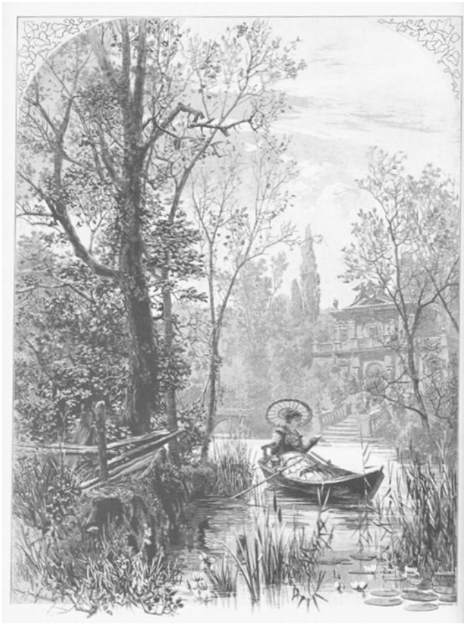
Ludwig Hans Fischer. »Im Herbst«. Illustrierte Frauen-Zeitung . Ausgabe der »Modenwelt« mit Unterhaltungsblatt , Jg. 11, H. 19, Erstes Blatt, 1884, S. 300.

tuelle, internationale Nachrichten und Berichte, deren Hauptakteurinnen Frauen sind oder die sich mit Themen befassen, die als für Frauen relevant galten (vgl. Illustrierte Frauen-Zeitung , Erstes Blatt 302-03). Diese kurzen Texte erzählen auch und im Besonderen von den Bildungs- und Berufserfolgen einzelner Frauen und bestätigen damit den bereits erläuterten Befund, dass auch in den Modemagazinen ein Engagement im Sinne der Frauenbewegung durch die Thematisierung ihrer zunehmenden Bemühungen um Bildungs- und Arbeitsmöglichkeiten für Frauen zum Teil stattfand. Die Ausgabe endet sodann mit Rezepten sowie einem Bericht