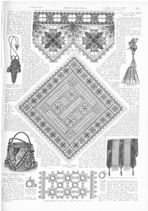
Illustrirte Frauen-Zeitung. Ausgabe der »Modenwelt« mit Unterhaltungsblatt, Jg. 11, H. 19, Zweites Blatt, 1884, S. 151.