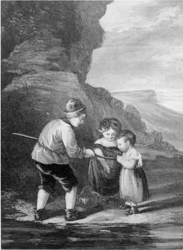
»Ei, ein Fischchen!«. Trowitzsch's Volkskalender , Jg. 43, 1870, Titelei.

hunderts im Mittelpunkt (vgl. Hiltl). Eine weitere Erzählung, Die Rose von Ganea , beschließt den Literaturteil und handelt von den Aufständen der griechischen Inseln gegen die osmanische Herrschaft im Jahr 1866 (vgl. Schmidt-Mellin). Zwischen diesen beiden Texten ist sodann Möllhausens Erzählung Fleur-rouge zu finden und bedient das sogenannte ›exotische‹ Genre.