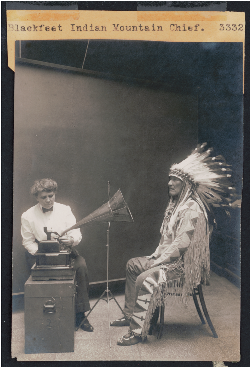
Abb. 1: Piegan Indian, Mountain Chief, listening to recording with ethnologist Frances Densmore [orig. Bildlegende]; 1916.