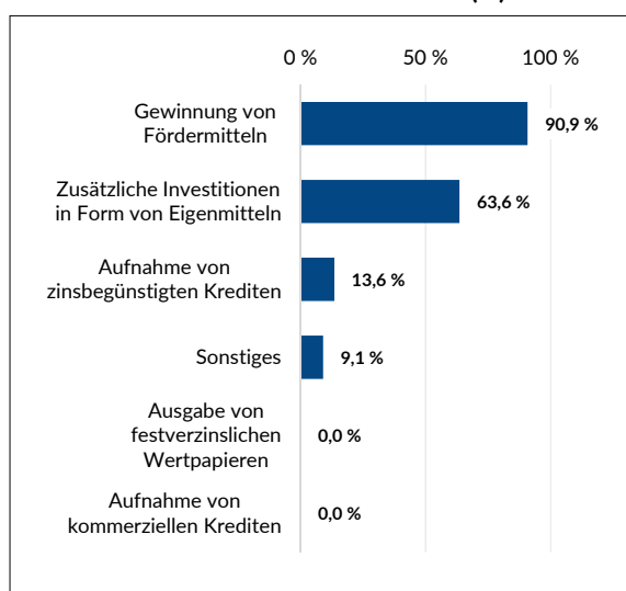
Grafik 2: Gewinnung von Ressourcen für Umsetzung eigener Projekte aus der Sicht der Fachkräfte in Gemeinden (%)