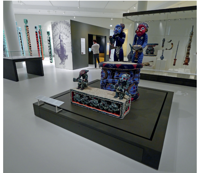
Abb. 2: Thron „Mandu Yenu“ des Königs Njoya, Bamum, Kamerun, Ende des 19. Jahrhunderts. Der Thron ist eines der zentralen Exponate der Afrika-Abteilung des Berliner Humboldt Forums. Über die Kontroverse, die sich seit Jahr und Tag an dem Thron entzündet, erfahren die Besucher nichts.

Direkt gegenüber ein weiterer Problemfall, das ikonische Ausstellungsstück der Afrika-Abteilung, der Thron „Mandu Yenu“ des Königs Njoya aus Bamum (Abb. 2).