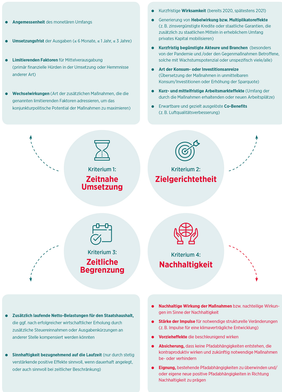
Abb. 2 Vier Kriterien zur Bewertung von Konjunkturmaßnahmen- Langversion (eigene Darstellung)