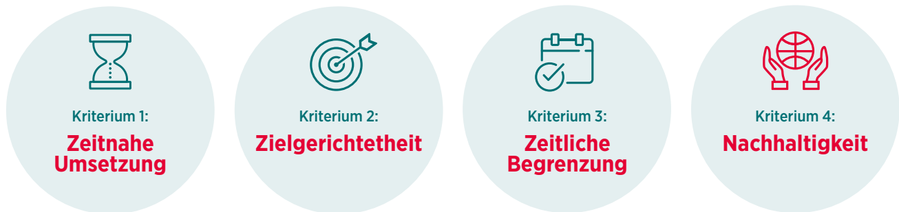
Abb. 1 Vier Kriterien zur Bewertung von Konjunkturmaßnahmen (eigene Darstellung)

Klimaschutz. Dafür werden vier zentrale Kriterien (s. Abb. 1), die im nachfolgenden Text systematisch abgeleitet werden, zugrunde gelegt.