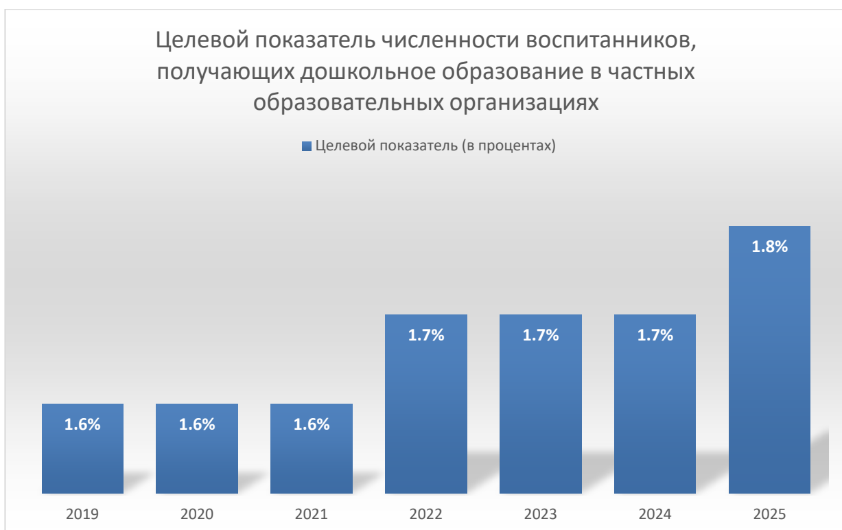
Рисунок 3 – Удельный вес в (%) численности воспитанников в частных ДОО

Доступность дошкольного образования для детей в возрасте от 2 месяцев до 3 лет планируется осуществить посредством увеличения количества новых мест в дошкольных образовательных организациях, введенных путем строительства, реконструкции, выкупа, перепрофилирования зданий и (или) сооружений, увеличением количества консультационных центров. Обеспечивать доступность дошкольного образования для детей в возрасте от 2 месяцев до 3 лет планируется осуществить посредством увеличения количества новых мест в дошкольных образовательных организациях, введенных путем строительства, реконструкции, выкупа, перепрофилирования зданий и (или) сооружений, увеличением количества консультационных центров.