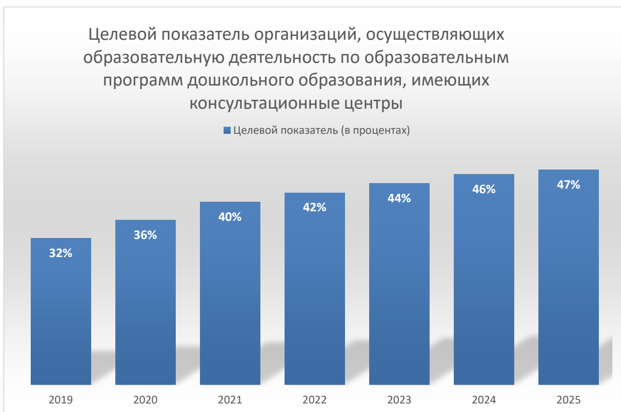
Рисунок 2 – Динамика роста в (%) консультационных центрах

представителей). Если в 2019 году 32% организаций имели консультационные центры, то к 2025 году их будет уже – 47%. (рисунок 2).