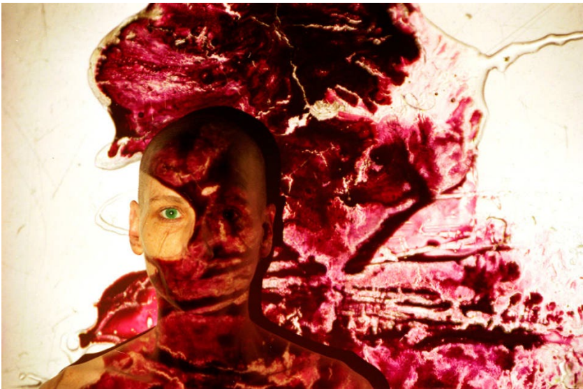
Abbildungen 2, 3

Christine Schlegel, Strukturen (mit Fine Kwiatkowski), Haus der Jungen Talente, Berlin/ Bauhaus Dessau, Dessau, 1984, u.a.