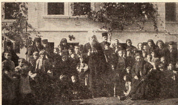
Блаженочивши патријарх Варнава међу децом у Хранилишту „Богдај“ 1936 године Прилоге слати на адресу Хранилишта: Битољ, Сарајевска улица број 43.

Fig. 1. Patriarch Varnava Rosić and Bishop Nikolai Velimirović visit the Bogdaj orphanage in 1936