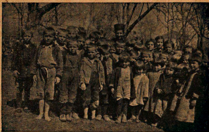
Мали хор Богдај