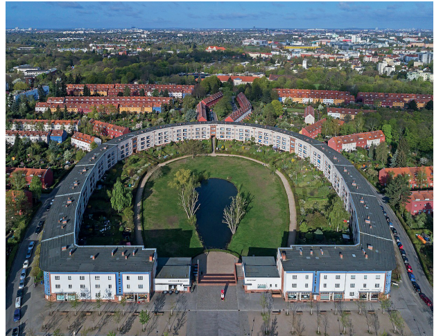
Abb. 4: Berlin-Britz, Hufeisensiedlung, 2017

Die Kommunalwahlen 1925 führten in Berlin zu einem deutlichen Stimmengewinn für die SPD, so dass vor allem die Gewerkschaften darauf drängten, Martin Wagner