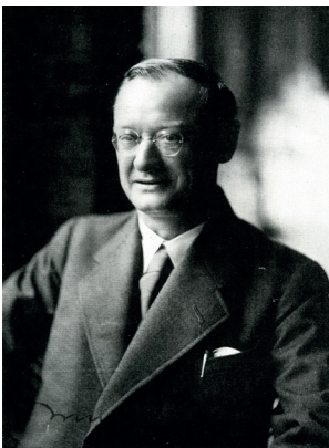
Abb. 1: Bruno Taut