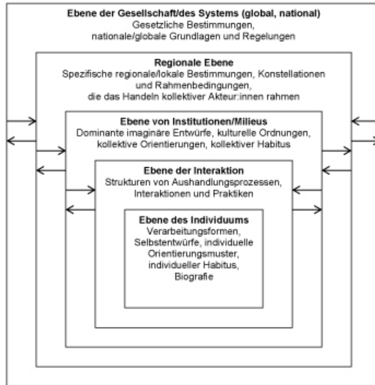
Abbildung 1: für Mehrebenenmodelle relevante, hierarchische Ebenen (HUMMRICH & KRAMER 2018, S.136, leicht geändert) 5 [5]

gesellschaftliche Kontexte individuelles Handeln beeinflussen (HELSPER et al. 2013, S.119; s. auch NIENHAUS 2018, S.84f.).