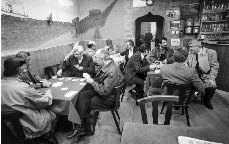
Türkisches Männercafé in Berlin-Kreuzberg, April 1990. Der Fotograf Ergun Çağatay (1937–2018) war für zahlreiche internationale Magazine und Nachrichtenagenturen tätig; in Deutschland fertigte er Bildserien zum Leben türkischer Einwanderer und ihrer Familien an, die in den vergangenen Jahren durch mehrere Ausstellungen bekannter geworden sind. Siehe etwa < https://www.youtube.com/watch?v=Tdiw_EkHSpo >, < https://www.youtube.com/watch?v=LPbUATQ9Deo > und < https://www.youtube.com/watch?v=8Us5bg6swQI >.