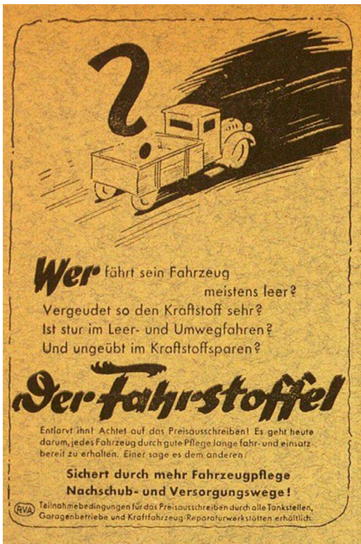
Abb. 1: Zeitungsanzeigen riefen auf, den „Fahrstoffel“ zur Anzeige zu bringen, der ohne Ladung fuhr, durch Umwege Kraftstoffe verschwendete und die Fahrzeugpflege vernachlässigte.

Mit Propagandaparolen wie „Fast den Kohlenklau“ appellierte das NS-Regime an den sparsamen Umgang mit der heimischen Kohle, die zwar reichlich gefördert wurde, durch den Krieg aber zum raren Gut geworden war (Wuttke 2018, S. 207). Die Kohlenöte der Weltkriegsjahre weckten auch das Bewusstsein für die Endlichkeit der ‚Schwarzen Kohle‘ und führten die Abhängigkeit der Energiewirtschaft von fossilen Rohstoffen deutlich vor Augen.