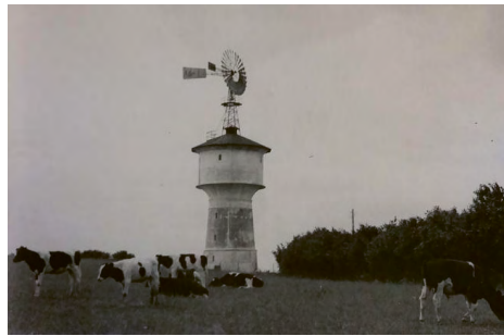
Abb. 2: Der Windmotor der Firma Köster versorgte um 1910 die 2000 Einwohner:innen von Klein-Niendorf in Norddeutschland mit Wasser.

Im trockenen Südwesten Frankreichs und in Norddeutschland fehlte am Anfang des 20. Jahrhunderts vielen Gemeinden und landwirtschaftlichen Höfen der Zugang zu einer Wasserversorgungsinfrastruktur (Hesse 2021). Zu Fuß und mithilfe von Kannen und Eimern schafften die Anwohner:innen das Wasser aus Brunnen und entfernten Wasserquellen herbei. Um die Si-