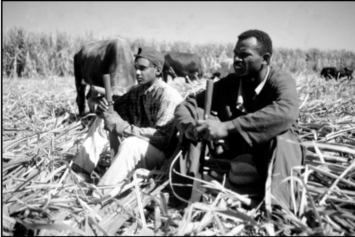
Abb. 3: Gemeinsame Feldarbeit bei der Zuckerrohrernte in Fiji