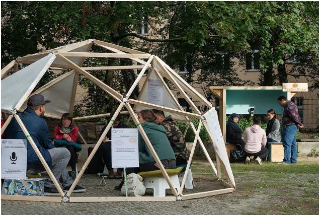
Abbildung 1 Die Erzählrunde (Vordergrund) und die Erzählecke (Hintergrund) während der Vor-Ort-Intervention in Berlin-Moabit, auf dem Platz an der Ecke Salzwedeler Straße/Quitowstraße