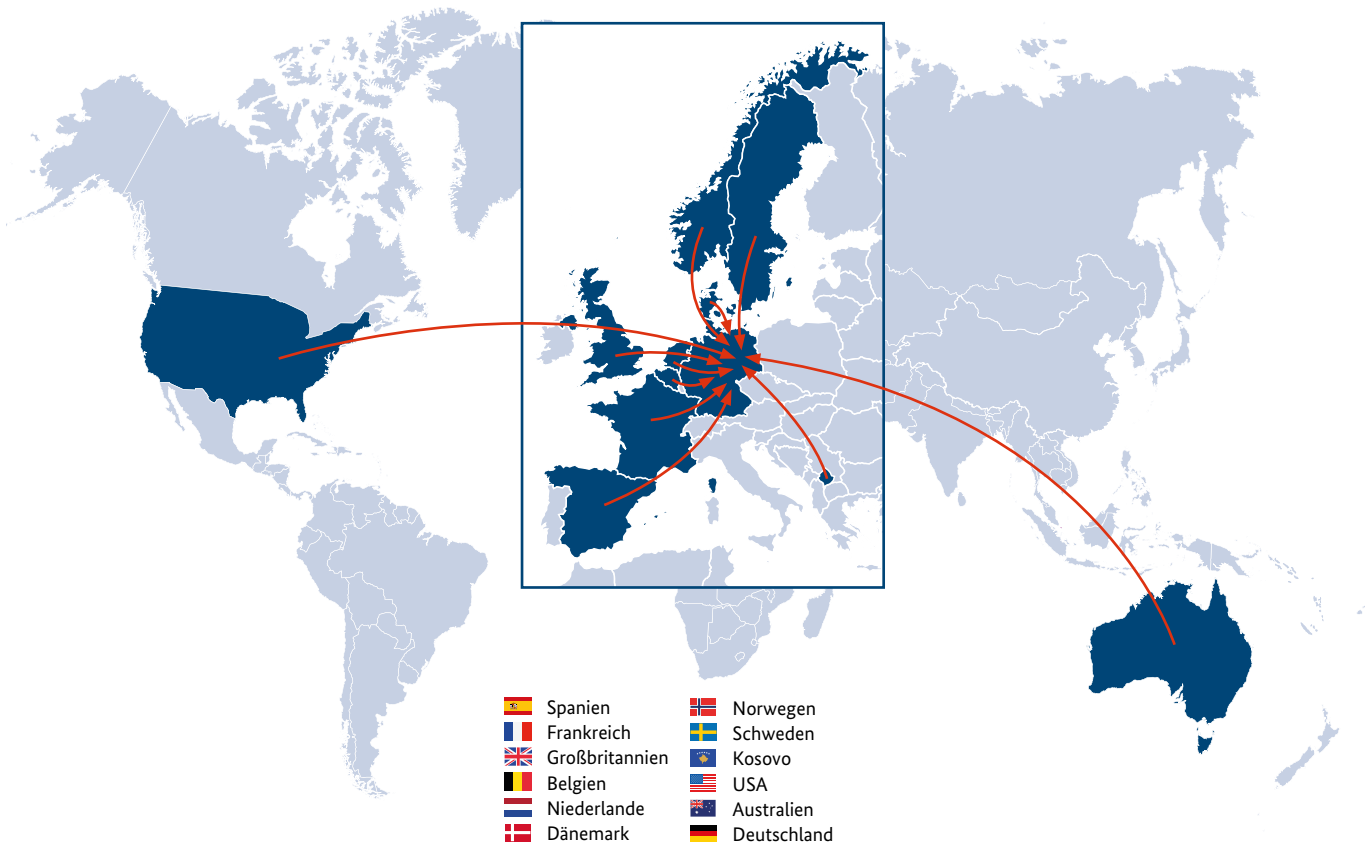
Abbildung 7: Verortung der internationalen Referent*innen