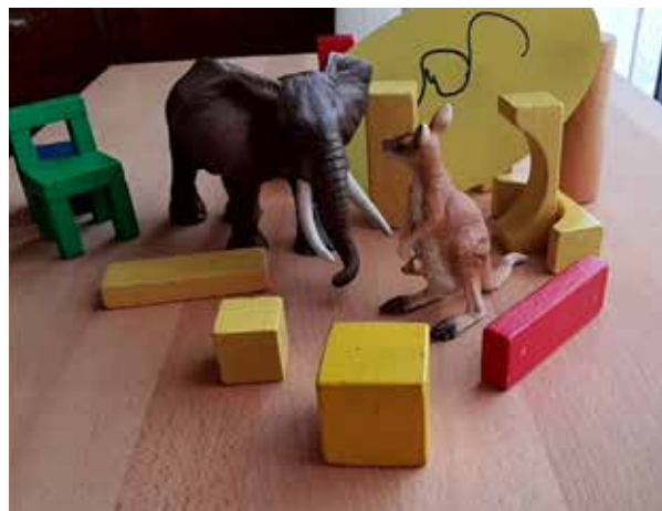
Abbildung 4: Fokus auf die Mutter-Tochter-Beziehung

Im Rahmen dessen werden auch Arbeitshypothesen zu den Aufträgen diskutiert, die an die Rückkehrerin, aber auch an die Beratenden, gerichtet sein könnten. Dabei sind offene und verdeckte Aufträge von der Familie, der Rückkehrerin und den Behörden zu unterscheiden und es ist zu reflektieren, welche Aufträge die Beratenden annehmen, ablehnen oder gemeinsam mit dem*der entsprechenden Beratungsnehmenden realisierbar umformulieren.