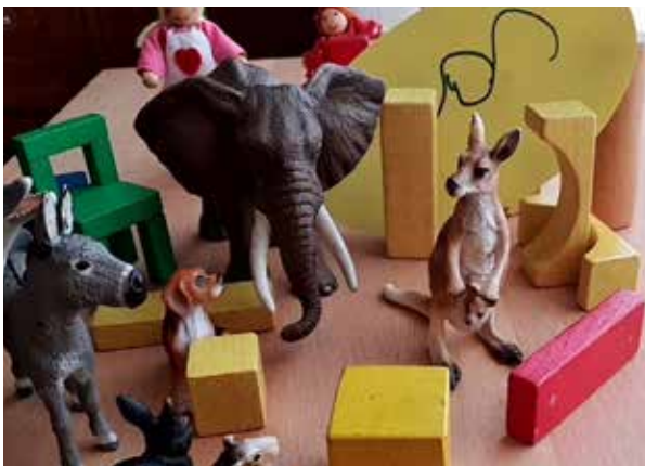
Abbildung 3: Nach der Rückkehr

Im zweiten Schritt wird die Rückkehr durch das Entfernen der Holzklötzchen-Grenze symbolisiert. Durch diesen Prozess öffnet sich der Blick auf zu erwartende Veränderungen und Dynamiken in der Akteur*innenkonstellation. An dieser Stelle werden auch Arbeitshypothesen zur emotionalen Lage der Rückkehrerin gebildet, die u.a. Gefühle der Überforderung, der Entwurzelung (vom Leben im sogenannten Kalifat des IS) und der Angst vor der Rückkehr, aber auch der Freude und einer befreienden Wirkung durch die Rückkehr reflektieren.