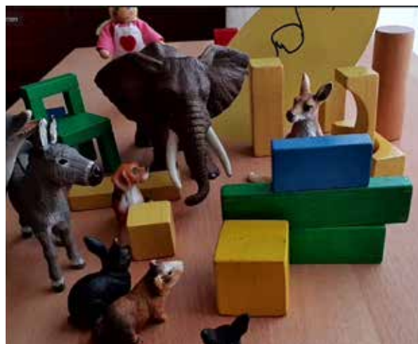
Abbildung 2: Vor der Rückkehr - Ausgangssituation mit Akteur*innen, Beziehungen und Themen

Damit sich die Beratenden auf die anstehende Beratungssituation bestmöglich vorbereiten können und dabei auch die möglichen Systeme, in denen sich die Indexperson bewegt, reflektieren, werden im Rahmen der Supervision mithilfe der Methode des Familienbretts verschiedene Szenarien vor und nach der Rückkehr „durchgespielt“. Zu Beginn werden durch die Supervisorin verschiedene Figuren, von Menschen über Tiere bis hin zu Holzklötzchen, auf einem Tisch platziert. Diese Figuren werden frei durch den*die fallbetreuende*n Berater*in ausgewählt. Für die Indexperson (die Rückkehrerin) wird als Figur ein Känguru ausgewählt. Im nächsten Schritt werden Figuren für die weiteren Familienangehörigen ausgewählt und je nach Nähe und Ferne zur Indexperson auf dem Feld platziert. Die Mutter (Elefant) steht der Indexperson am nächsten. Zudem werden der Vater der Kinder, die Geschwister, der Freundeskreis sowie die Beratern selbst platziert. Hinzu kommen Akteure wie das