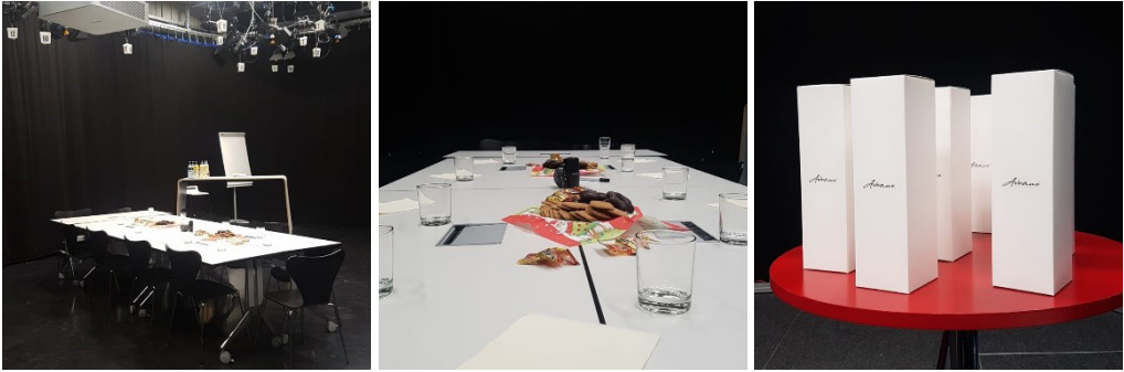
Abbildung 4: Setting der Gruppendiskussion

Die ehrliche und persönliche Beantwortung der Fragen sowie die positive Reaktion der anderen Teilnehmer darauf bestätigten, dass sich die Interviewenden wohlfühlten. Auch die Interviewer harmonierten gut mit den Teilnehmern und so konnte ein interessantes Gespräch stattfinden, in dem alle Teilnehmer gleichermaßen dazu beitrugen, ihre Sicht der Dinge darzustellen.