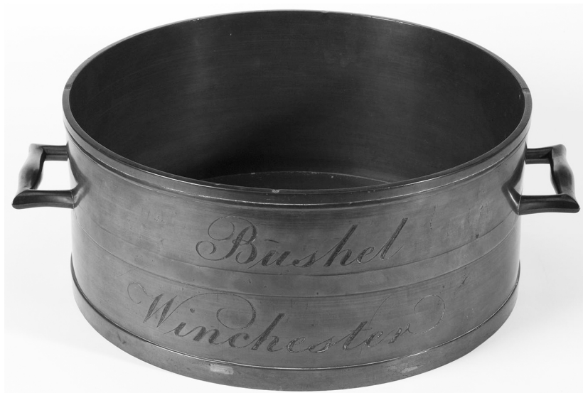
Abb. 2: Bronzener Maßkübel eines Winchester Bushels, ca. 1818.