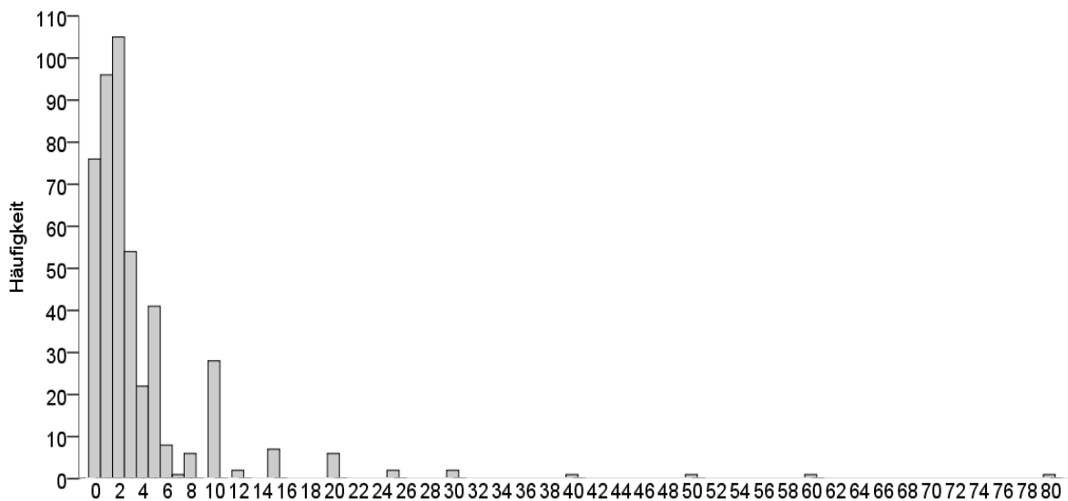
Abbildung 2: Für wie viele Studien pro Jahr würden Sie das Onlinelabor nutzen?

Alle folgenden Ergebnisse beziehen sich auf die 384 Antwortsätze, laut derer mindestens eine Studie pro Jahr durchgeführt würde. Zuerst wurde nach der durchschnittlich erforderlichen und nach der maximal erforderlichen Stichprobengröße gefragt. Der Wertebereich für die durchschnittliche Stichprobengröße umfasst 3 bis 5.000, wobei 91% der Befragten angeben, bis zu 500 Probanden pro Studie zu benötigen ( md = 200 ). Der Wertebereich für die maximale Stichprobengröße umfasst 8 bis 1.000.000, wobei 49% der Befragten angeben, bis zu 500 Probanden pro Studie zu benötigen ( md = 600 ).