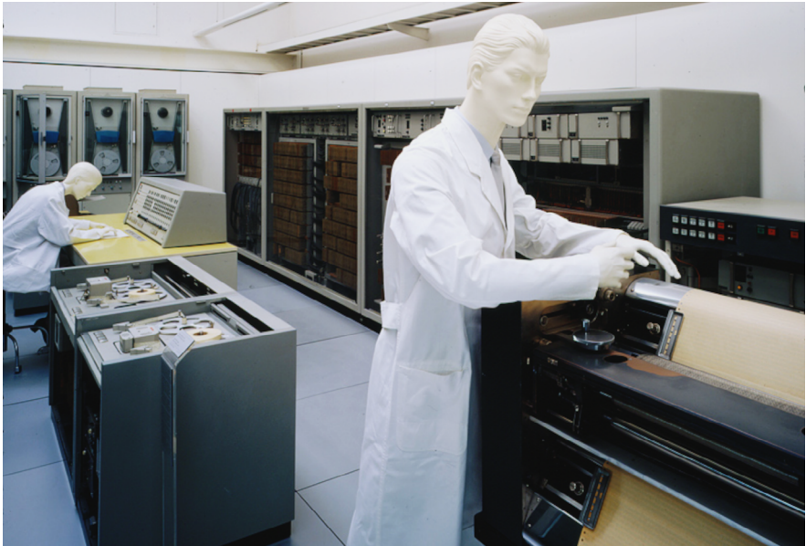
Abb. 2: Rechenanlage Siemens 2002 im Kabinett »Universalrechner in Transistortechnik« der Dauer- ausstellung Informatik im Deutschen Museum München

geräte und Tafeln, Kryptologie, Automaten und Lochkartenmaschinen sowie Universalrechner (Abb. 2) 27 . Das Internet wird in der Ausstellung nicht thematisiert. 28