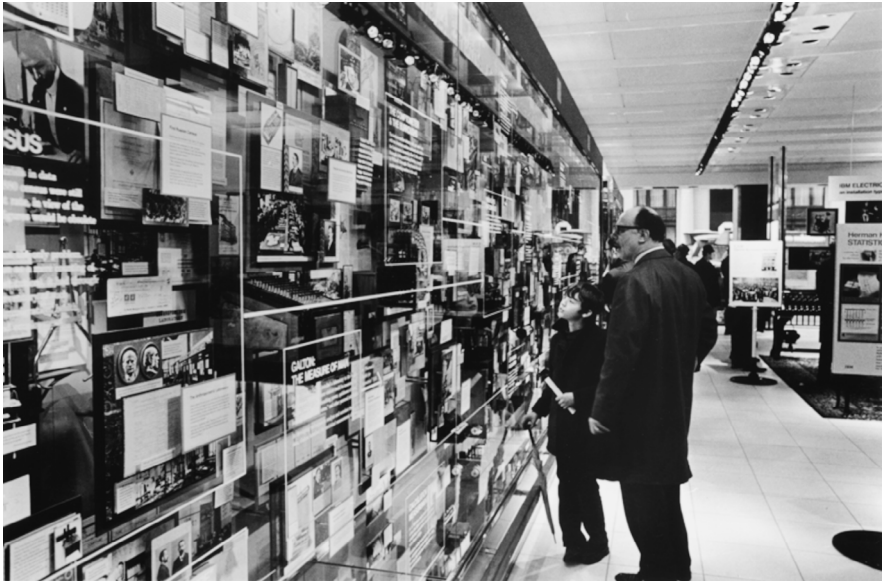
Abb. 1: Eames Office: A Computer Perspective, 1971

tion ein Netzwerk von Personen sowie wissenschaftlichen, technischen und gesellschaftlichen Entwicklungen und Ereignissen, das mit der >ersten Generation moderner Computer< 1950 endete. 18