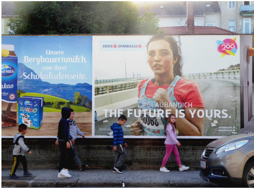
Abb. 1: Plakat der Ersten Sparkasse in Graz, September 2019.

gleichzeitig. Es geht um Selbstverwirklichung als ständige Selbstüberschreitung – immer noch eine »Extra-Meile« mehr – für »KundInnen«, die nicht nur wollen, dass der Bankverkehr funktioniert, sondern die ihrerseits höchste Ansprüche subjektiven Erlebens stellen und in permanente Begeisterung zu versetzen sind. Den geradezu evangelikalen Impetus der Anzeige unterstreicht ein Glaubensbekenntnis des abgebildeten Wunsch Kandidaten, die Anrufung seines kreativen Ichs verschmilzt mit dem Beschwören eines transzendenten digitalen Universums: »Ich glaube daran, dass Big Data ohne Big Idea nur Einsen und Nullen sind.«