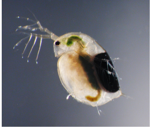
Abb. 3: Weibliche Daphnia magna

Fluss darüber kommunizieren lässt, »wie es ihm geht«. Die mit der App verbundene »Website sollte sich anfühlen wie der heiße Teer unter den nackten Füßen«. 58