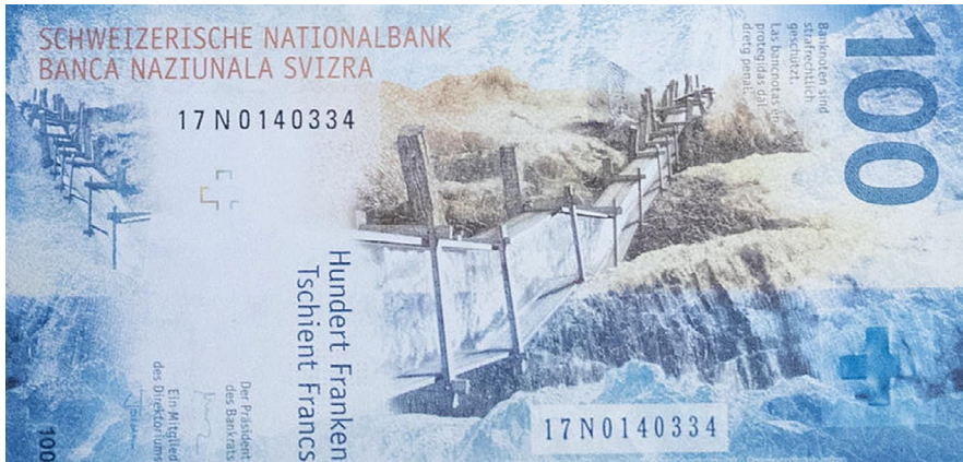
Abb. 1: Suonen auf 100 Franken-Schein

>kleine Technologien< involviert sind. Nachdem das Wässern mit der Industrialisierung der Landwirtschaft an Bedeutung verloren hatte, sehen sich die Bewohner*innen des Tals seit neuestem mit anderen Tälern der Region durch eine klimawandelinduzierte Trockenheit verbunden und haben die Bewässerung fortgesetzt. Dabei sind die Suonen durch Rasensprenger abgelöst worden, auf den 100-Franken-Geldschein gewandert (Abb. 1) und entwickeln sich nun in der Debatte ums Kulturerbe wieder zu neuen waterworlding -Akteuren. 27