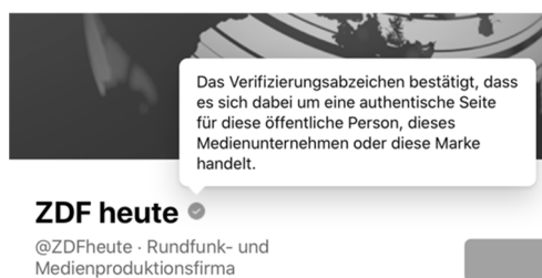
Abb. 2: Hintergrundinformationen zum Verifikationshinweis