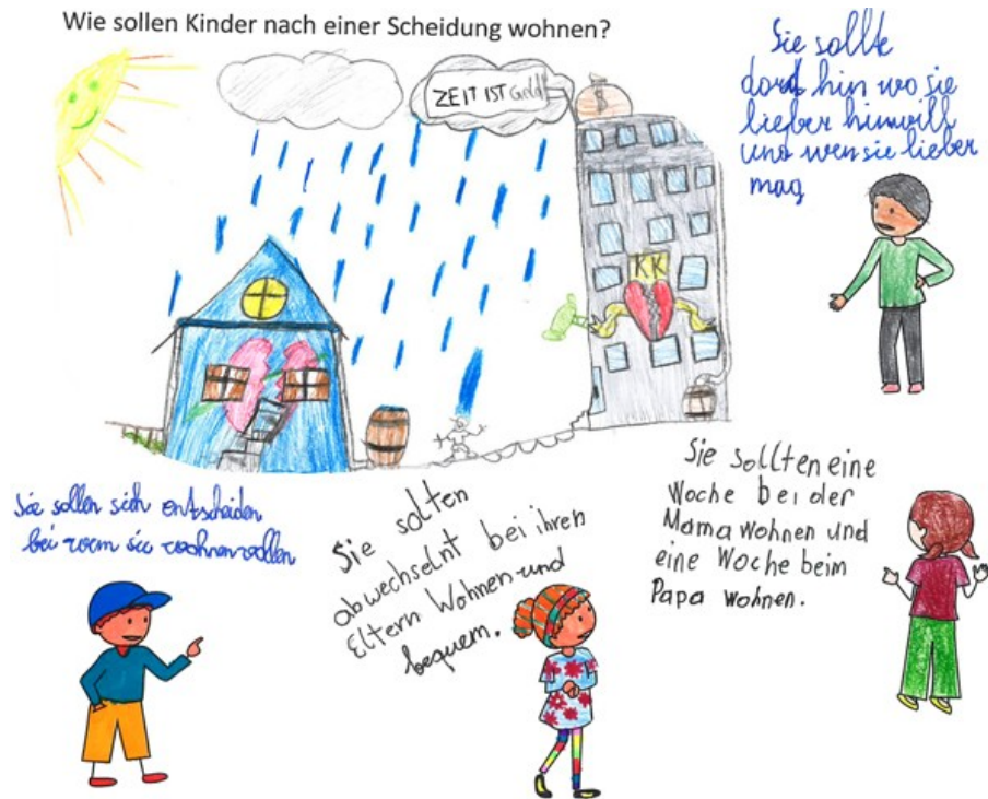
Abbildung 3: Concept Cartoon der beteiligten Kinder [43]

Neben Einzelbildern gestalteten die Kinder auch Bildgeschichten in Form von Comics. Ein Ausschnitt aus einer solchen Bildgeschichte wird in Abbildung 4 gezeigt: