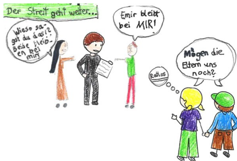
Abbildung 4: Ausschnitt aus einem Comic der Kinder [44]

Neben Einzelbildern gestalteten die Kinder auch Bildgeschichten in Form von Comics. Ein Ausschnitt aus einer solchen Bildgeschichte wird in Abbildung 4 gezeigt: