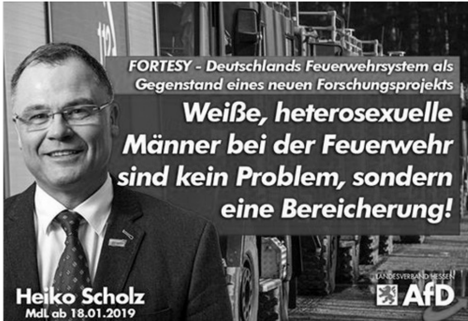
Abbildung 1: AfD zu FORTESY