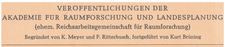
Abb. 2: Auszug aus der Titelei der Reihe „Raumforschung und Landesplanung. Abhandlungen“ 1950, Band 16 (Egner 1950: 2)

Die Akademie hatte also die Arbeit der Reichsarbeitsgemeinschaft mit hoher perso- neller und methodischer, wenn auch inhaltlich angepasster Kontinuität fortgesetzt. Dazu bekannte man sich offen, etwa in den Titelei en ihrer Publikationen (siehe Abb. 2).