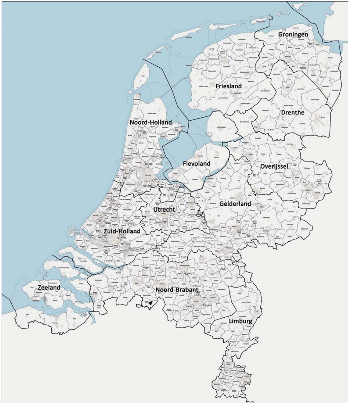
Abbildung 1: Städte und Gemeinden der Niederlande und die zwölf Provinzen