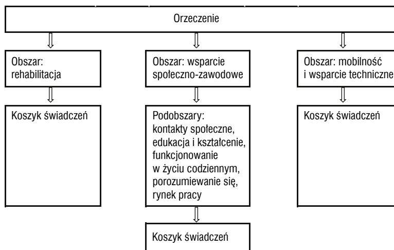
Rysunek 1. Obszary wsparcia w orzeczeniu