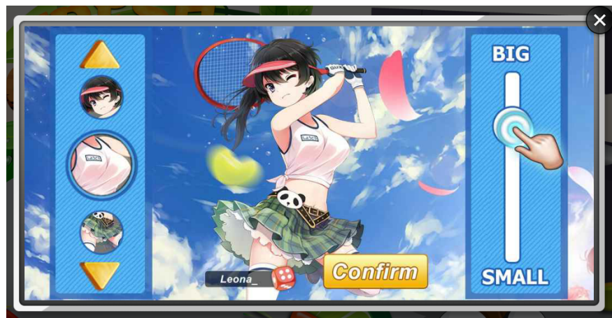
Screenshot – Werbung in „Kinder Gesunde Salat Bar Spiel“ (Android, 20.6.2017)

Overlay in Form von Videos und statischen Anzeigen auf, die sich in der Regel durch Klicken auf einen x-Button schließen lassen. Des Weiteren fanden sich Display-Ads am Bildschirmrand. Vereinzelt wurden auch fragwürdige bzw. für die junge Zielgruppe gänzlich ungeeignete Werbeinhalte