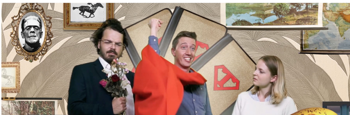
Abbildung 2: Standbild aus animiertem Intro-Video (Grundlagenbaustein 1: Einstieg, Standort- und Rollenbestimmung) 5

Diese Struktur hat den Anspruch eines didaktischen Doppeldeckers: Teilnehmende sollen Aspekte, die ihnen in den Grundlagenbausteinen vermittelt werden, in der Struktur des Programms wiederfinden und deren Sinnhaftigkeit im eigenen Lernprozess erfahren können. Dazu gehören neben dem Aufbau von Lerneinheiten auch die Möglichkeiten der medialen Gestaltung (z. B. Video, Audio, Prezi- oder PowerPoint-Präsentationen) sowie der Einsatz kollaborativer digitaler Werkzeuge. So werden fachlicher, didaktischer und medienbezogener Kompetenzerwerb verknüpft. Dies betrifft vor allem den Leistungsnachweis, der in Form eines Sammel-Portfolios über OLAT eingereicht wird. Die Teilnehmenden absolvieren im Laufe eines Kurses ca. fünf bis sieben Übungen. Die Übungen sind teilweise textbasiert, es müssen aber Kompetenz-Spiderwebs erstellt, Mindmaps gezeichnet oder Smartphone-Videos gedreht werden, Letzteres beispielsweise, wenn es um die Analyse der eigenen Auftrittskompetenzen geht.