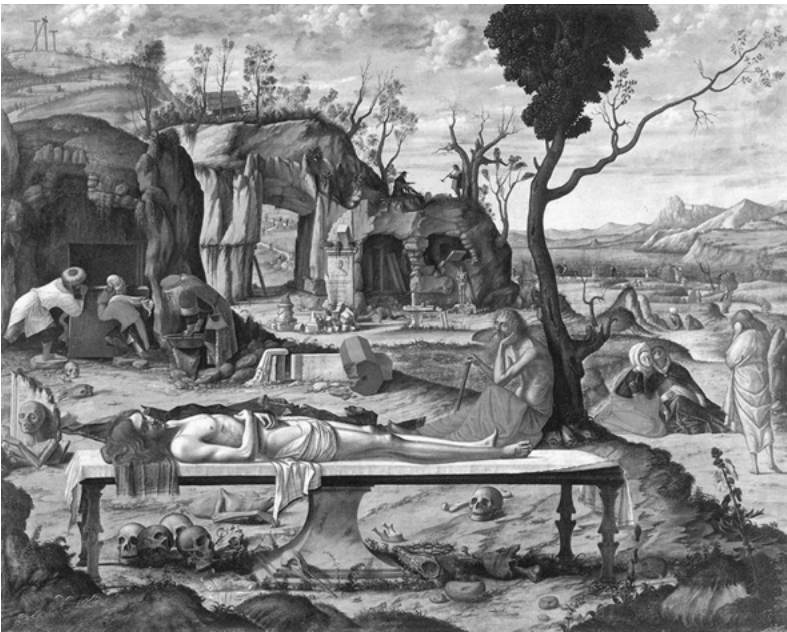
Abbildung 1: Vittore Carpaccio: Grabbereitung , vmt. 1505-1520, Berliner Gemälde Galerie, Staatliche Museen zu Berlin, Preußischer Kulturbesitz, Leinwand 145 cm x 185 cm.