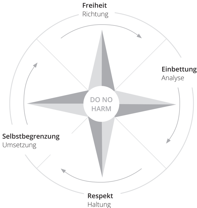
Abbildung 1: Der ethische Kompass

in allen Kulturen in der einen oder anderen Form finden lässt. 6 Der nachfolgend vorgestellte ethische Kompass 7 ist der Versuch einer Entfaltung dieses Prinzips als systematische Heuristik: