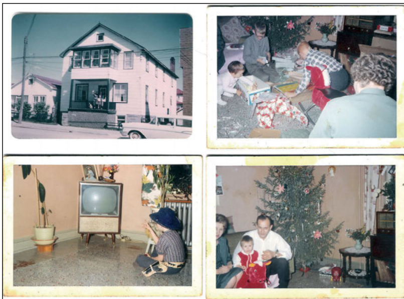
Abbildung 6: Bilder von Verwandten aus dem Westen, 1959.

sonderen Anlässen genutzt und gern vorgezeigt, darunter leere Shampoo-Flaschen, Seifen, Konfektverpackungen und andere Kleinigkeiten, mit denen die Menschen ihre Wohnungen zierten.