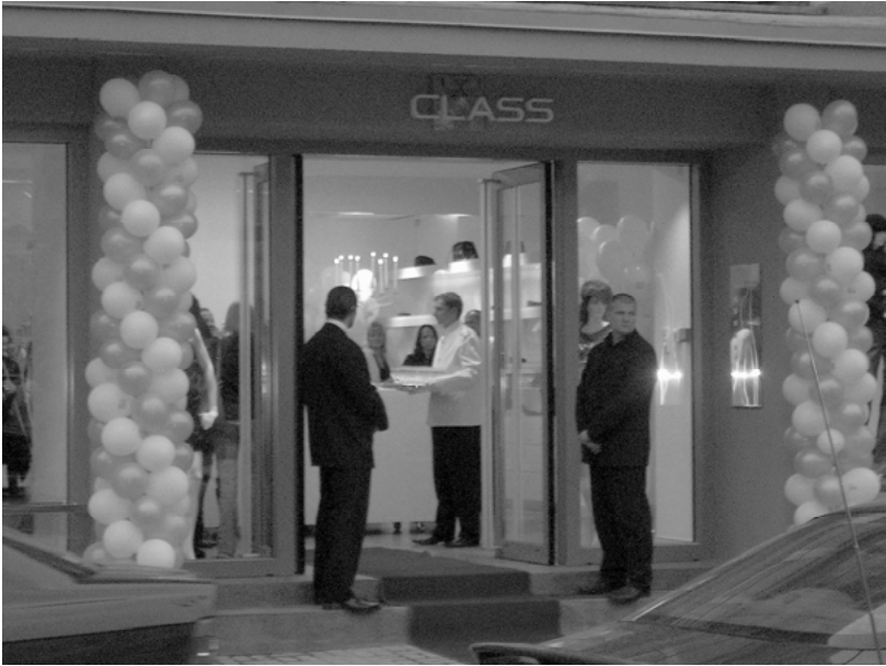
Abbildung 1: Eröffnung einer Edelboutique, Vilnius 2005, fotografiert von A. Vonderau.

zu problematisieren, unter denen die Forschung zum Thema bislang organisiert wurde.