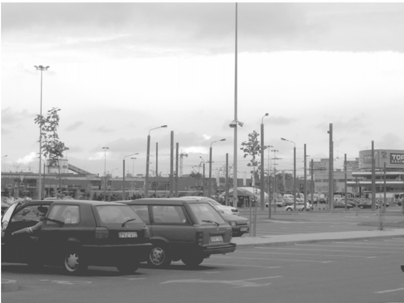
Abbildungen 11 und 12: Die alte Platte und die neue Konsumlandschaft, fotografiert von A. Vonderau, 2005.