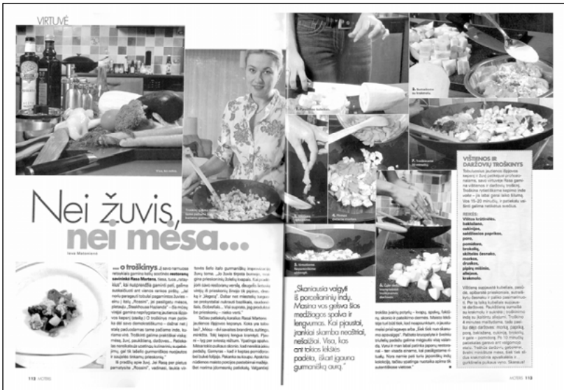
Abbildung 7: Moteris, September 2005, S. 112-113.

Fotoreportage, wie sie ihr Lieblingsgericht zubereitet, Geschnetzeltes mit Huhn und Gemüse. 286