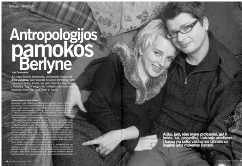
Abbildung 2: Antropologijos pamokos Berlyne , in: Laima , 2/137 (2005), S. 48-49.

Als ich zum Ende des Monats die neue Ausgabe von Laima am Kiosk kaufte, fand ich in der Heftmitte ein doppelseitiges Hochglanzfoto von mir und meinem Mann, übertitelt als »Anthropologiestunden in Berlin«. Der dazu gehörige Bericht verquickte im süßlich-übertriebenen Ton einer Homestory mein persönliches und berufliches Leben. Wie meine Informanten, so wurde nun auch ich in der Welt des Glamour situiert, mithilfe einer konventionalisierten medialen Inszenierung, zu deren Merkmalen die emotionalisierte Darstellung der Person in Bild und Text gehört.