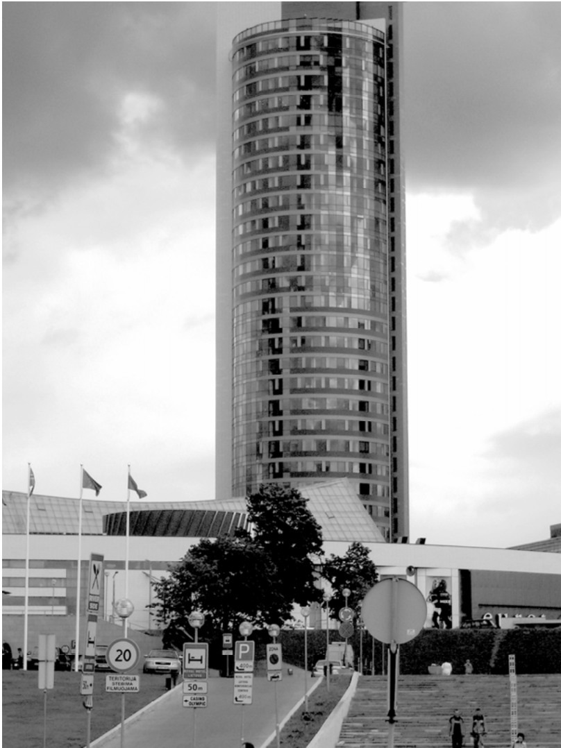
Abbildung 13: Das neue Stadtzentrum, fotografiert von A. Vonderau, 2005.

pien auf alle Lebensbereiche übertragen werden. So wird der ›Körper der Gewinner‹ konstituiert und der Markt »as a way of life« praktiziert. 388