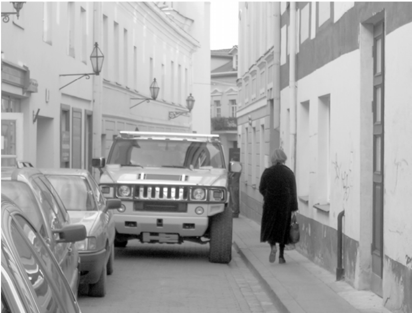
Abbildungen 4 und 5: Vilnius 2005.