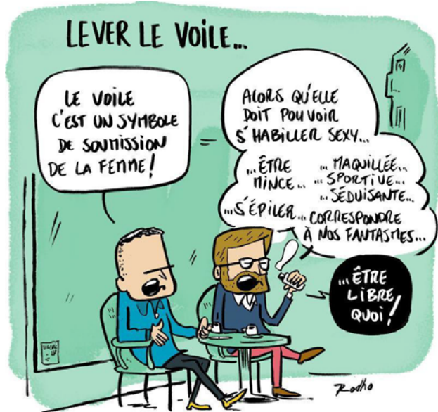
Lever le voile (Rodho) 23

Der Blick des sogenannten Westens auf Muslim*innen ist durch eine koloniale Tradition geprägt, die von Edward Said 1978 erstmals als Orientalismus bezeichnet wurde. Said beschreibt in dem gleichnamigen Buch eine imaginäre Geografie, die den „Orient“ als „Orient“ und damit als das paradigmatische „Andere“ des „Westens“ herstelle. 24 Dabei entstehe im Umkehrschluss der „Okzident“ als im Vergleich immer schon überlegen und dominant: