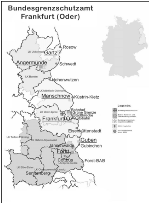
Abbildung 1: Bundesgrenzschutzamt Frankfurt (Oder)

Die grenzpolizeilichen Aufgaben umfassen, so will es das Gesetz über die Bundespolizei (BPolG), die grenzpolizeiliche Überwachung der Grenzen zu Lande, zu Wasser und aus der Luft, die polizeiliche Kontrolle des grenzüberschreitenden Verkehrs einschließlich der Überprüfung der Grenzübertrittspapiere und der Berechtigung zum Grenzübertritt, der Grenzfahndung und der Abwehr von Gefahren sowie im Grenzgebiet bis zu einer Tiefe von 30 km die Abwehr von Gefahren, die die Sicherheit der Grenzen beeinträchtigen. Die Struktur der Bundespolizei wurde mit Wirkung zum 1. März 2008 nach dem Willen des Bundesministeriums des Inneren (2008) verschlankt und effizienter gestaltet, um den Herausforderungen eventueller terroristischer Bedrohungen, wachsender Verkehrsströme und Schengen beitretender Nachbarstaaten gewachsen zu sein.