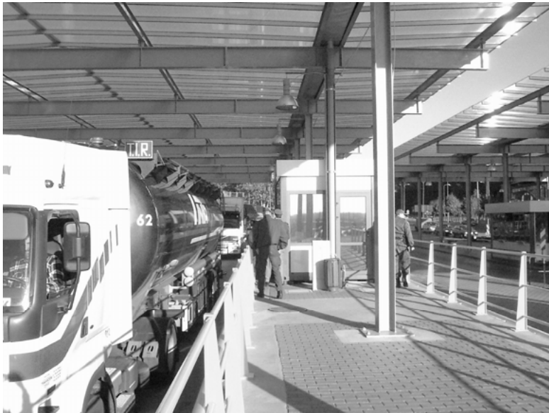
Abbildung 7: LKW-Kontrolle in Świecko

Die eigentliche Feldforschung in Świecko nach Erhalt der deutschen Erlaubnis gestaltete sich zumindest im Hinblick auf die Anreise nicht mehr ganz so spektakulär. Mittlerweile über ein Auto verfügend, rollte ich gemütlich am Stau vorbei zu den deutschen Dienstcontainern. Der Übergang Świecko befindet sich auf polnischer Seite der Oder. Während die SG in einem großen Kontrollgebäude logiert, das sich zwischen Ein- und Ausreisepuren befindet, wurde der deutsche Grenzschutz Anfang der Neunzigerjahre in ein aus Baucontainern bestehendes Provisorium verbannt. Jahrelang war unklar, ob auch die BPOL in das Gebäude einziehen sollte, mit der vollständigen Übernahme des Schengen-Acquis und dem Abbau der Grenzkontrollen hat sich diese Frage jedoch mittlerweile erübrigt: Am 17. Dezember 2007 hat das »Gemeinsame Zentrum der deutsch-polnischen Polizei- und Zollzusammenarbeit« in Świecko den Betrieb aufgenommen, wo über 60 Mitarbeiter der deutschen und polnischen Sicherheitsbehörden direkt zusammenarbeiten.