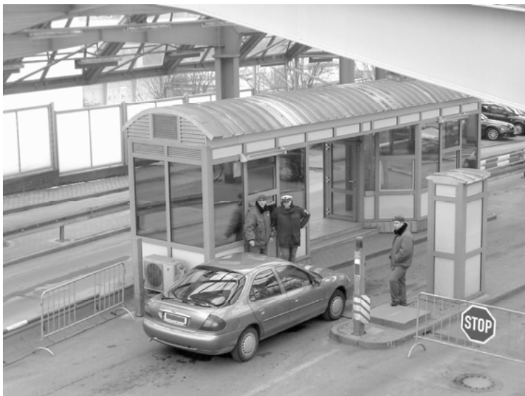
Abbildung 4: Ein-Stopp-Kontrolle an der Stadtbrücke in Frankfurt (Oder)

Relevant für die Ein-Stopp-Kontrolle sind demnach nicht allein die Kenntnisse des Kontrollvorgangs an einer Schengen-Außengrenze respektive EU-Binnengrenze, sondern es wird auch Wissen über die spezifische Kontrollsituation des Nachbarn von den Grenzschützern erwartet, denn: »Policing on the frontier also requires the ability to translate across legal traditions« (Sheptycki 2002b: 88). Schließlich erfordert die Ein-Stopp-Kontrolle die Fähigkeit und den Willen, mit den Grenzschützern von der anderen Seite nicht nur zusammenzuarbeiten, sondern sie im Bedarfsfall auch zu sichern. Weder auf polnischer, noch auf deutscher Seite war die Ein-Stopp-Kontrolle dabei von langwierigen Vorbereitungen begleitet, sondern, wie ein Pole erzählt: »Wir sollen halt zusammenarbeiten und irgendwie klar kommen«. Nach großer Skepsis zu Beginn und einer anfänglichen Eingewöhnungsphase kehrte schnell Normalität in den Kontrollboxen ein.