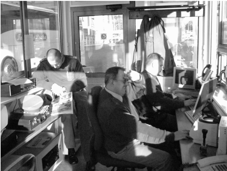
Abbildung 5: Kontrollbox am Übergang Świecko

Im Fall einer solchen Anordnung haben auch viele Deutsche die polnische Wortwahl übernommen, statt »Zweite Spur!« tönt dann ein vielstimmiges »Drugi pas!« durch die Boxen. An der Stadtbrücke Frankfurt (Oder) kommen zu PKW-Ein- und Ausreise noch die im Dienstgebäude befindlichen Fußgängerübergänge, im Jargon auch Füße-Einreise und Füße-Ausreise genannt. Diese Positionen zählen zu den am wenigsten beliebten, hier ist die Bewegungsfreiheit am geringsten. Die Grenzschützer sitzen auf hohen Stühlen hinter einer Art Theke. Sie sind von den Reisenden ebenfalls durch eine verspiegelte Fensterscheibe getrennt, die dem Reisenden nur bei näherer Betrachtung einen Blick ins Innere erlaubt, dem Grenzschützer jedoch gute Sicht gewährt.