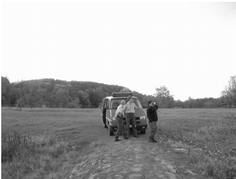
Abbildung 3: Gemeinsame Streife auf deutscher Seite

Ein polnischer Grenzschützer bringt dies auf den Punkt: »Die Deutschen sind darauf vorbereitet, dass einer zu ihnen rüberkommt, und wir sind darauf vorbereitet, dass uns einer abhaut. Die warten, ob einer kommt, und wir müssen die alle finden, einfangen, festnehmen, nicht rüberlassen«. Die Kontrolle der Gästelisten grenznaher Hotels im Hinblick auf möglicherweise zukünftige illegale Grenzübertreter gehört ebenso zum Repertoire der SG wie die Überprüfung von die Ausfallstraßen säumenden ausländischen Prostituierten. Die Gemeinsamen Streifen sind zum selten hinterfragten Alltag geworden, und selbst wenn viele Streifen so genannte »Schweigeschichten« sind, werden die meisten Grenzschützer nur mit den Schultern zucken, denn »das machst du eben, weil es dein Job ist«.