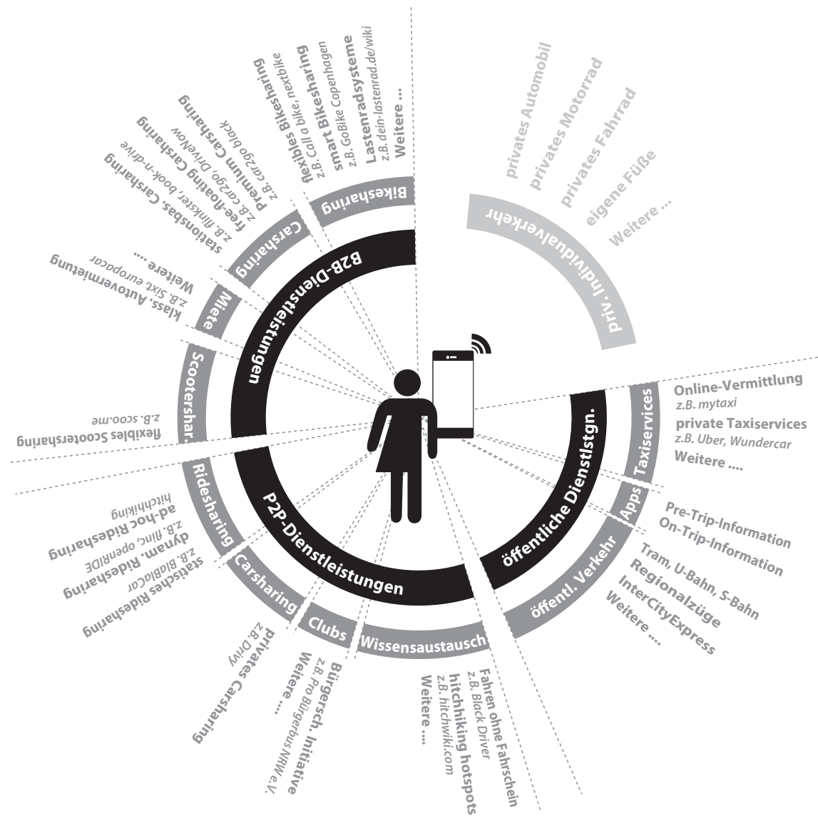
Abbildung 1: Multioptionalität im Internet der Mobilitätsdienstleistungen