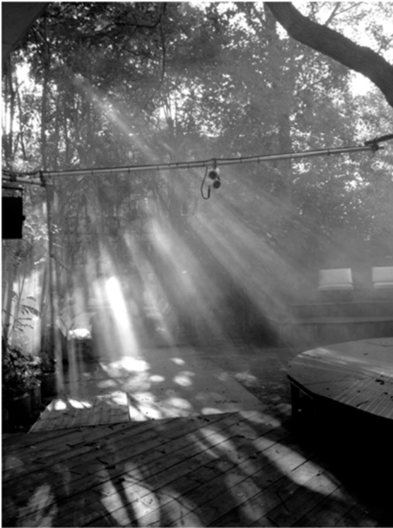
Abbildung 1: Außenbereich des blank

ne zwei Insignien auf, an denen sich die Angesagtesten seiner Zunft erkennen lassen – die strenge Tür und das Fotografierverbot. Kurz, das about blank hat sich einen festen Platz in der Berliner Clubszene gesichert. Was viele Nachtschwärmer allerdings nicht wissen: Das blank hat den Anspruch ein solidarisch organisierter Betrieb zu sein.