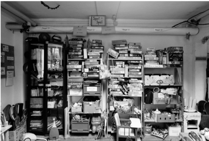
Abbildung 1: Die Spieleabteilung im Leila

Damit sind die drei Voraussetzungen genannt, die man erfüllen muss, um Mitglied im Leila zu werden und Zugang zu einer großen Auswahl an Artikeln zu erhalten, die man sich ausleihen darf. Leila ist eine Art Club, der exklusiv für seine Mitglieder existiert. Man gibt einen Gegenstand und erhält 800 Sachen dafür – denn genau so viele Dinge kann man sich im Leila ausleihen.