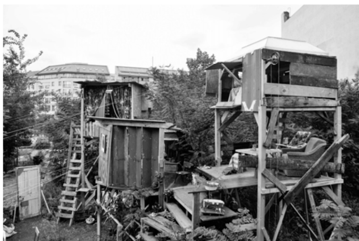
Abbildung 2: „The Pale Blue Door“. Baumhäuser erwachsen lassen