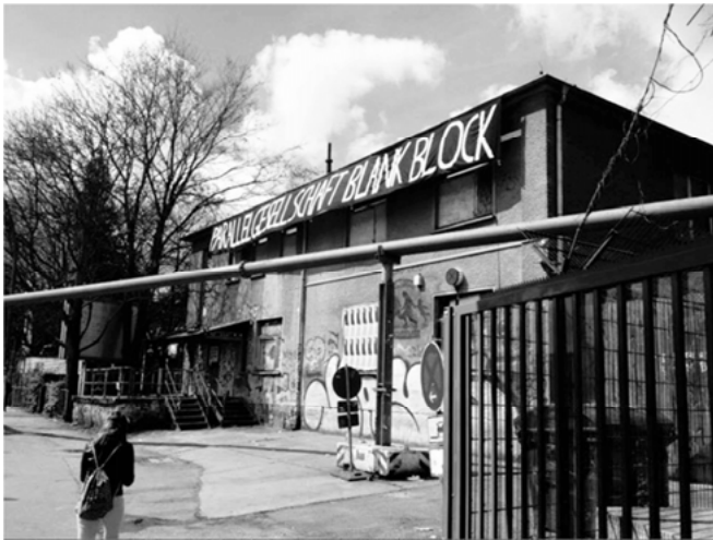
Abbildung 2: Eingang zum blank

Die Mitglieder des Kollektivs verstehen die Beziehungen, in denen sie stehen, als solidarische Beziehungen. Aber diese Solidarität ist nicht automatisch da. Sie wird in direkten Aushandlungsprozessen, die allen Beteiligten viel Zeit und Mühe abverlangen, hart erkämpft. Dieser Kampf bestimmt das Leben der Kollektivistas nicht nur, sobald sie den Club betreten, sondern auch in anderen Lebensbereichen. „Wir haben uns fast alle mit unserer Existenz in diesen Laden reinbegeben.“ „Der Club ist emotional und mental immer dabei.“ Aber auch, wenn der Club allen viel abverlangt, steht für die Kollektivistas letztlich doch fest, dass die Mühe sich lohnt: „Ich würde nichts anderes machen wollen und ich habe auch keinen Plan B.“