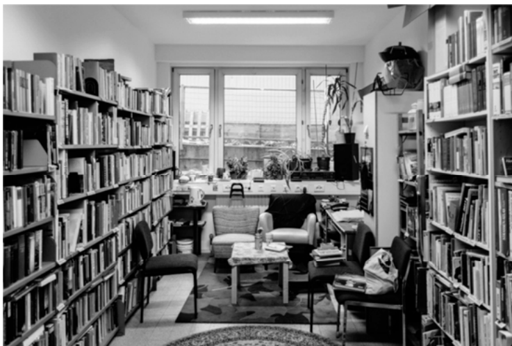
Abbildung 4: Eine große Auswahl an Büchern im Ula

zwischen den beiden Partnern der Transaktion (Znoj 1995). Daraus lässt sich ableiten, dass die beiden Beteiligten in einer sozialen Beziehung zueinander stehen, was in den Umsonstläden nicht der Fall sein muss. Sahlins Idee von Redistribution hat den größten Bezug zu dem Konzept von Geben und Nehmen in einem Umsonstladen. Er geht davon aus, dass es keine direkten Tauschbeziehungen gibt, sondern innerhalb einer sozialen Gruppe, die systematisch miteinander zusammenhängt, die Gegenstände gesammelt und dann umverteilt werden (Sahlins 1974). Dieses System scheint auf den ersten Blick ähnlich zu der Praxis einer karitativen Spende, beispielsweise der Kleidersammlung des Roten Kreuz. Doch der Umsonstladen spricht bei den Geber*innen und Nehmer*innen dieselben Personen an. Es sollen keine strukturellen Unterschiede zwischen diesen Personenkreisen gemacht werden, wie es bei Spendengeber*innen und Spendennehmer*innen der Fall ist. Außerdem soll niemand aus dem Konsumkreislauf ausgeschlossen werden: Alle sollen sich als Teil dessen fühlen.