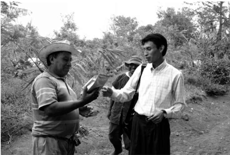
Abbildung 2: Übergabe des Kaffee-Endprodukts an die Produzent*innen von AMNSI

Dies gilt auch für die Endabnehmer*innen und Konsument*innen. FairBindung verkauft den Kaffee sowohl über ihren Onlineshop als auch in einigen alternativen Geschäften und Cafés in Berlin, wobei sie zu den Großabnehmer*innen immer direkten Kontakt suchen und pflegen. Dahinter steckt mehr als bloße Kundenbetreuung. FairBindung macht es sich sowohl zur Aufgabe, den Produzent*innen der AMNSI-Kooperative davon zu berichten, wo ihr Kaffee konkret verkauft und getrunken wird, als auch den Verbraucher*innen die Geschichte ihres Kaffees zu erzählen. Dafür finden sich auf den Kaffeepackungen selbst und auf der Internetseite von FairBindung Informationen zu Herkunft, Produzent*innen und zur Weiterverarbeitung des Kaffees.