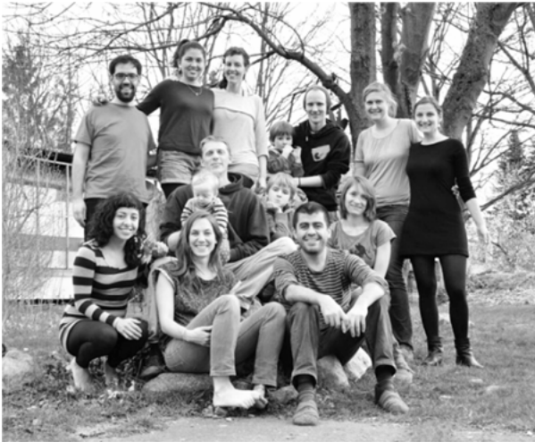
Abbildung 1: Das FairBindungskollektiv

„eine enge Verbindung, die auf gleichen Werten beruht. Wir haben uns zusammengeschlossen, weil wir eine gleiche Idee, gleiche Werte, gleiche Normen teilen und die miteinander leben und auf eine bestimmte Art und Weise miteinander arbeiten wollen.“