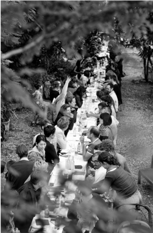
Abbildung 1: Zusammen am Gartentisch