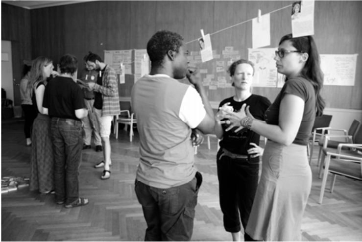
Abbildung 3: Diskussionen in einem Seminar von FairBindung

Aruns Zitat legt nahe, dass FairBindungs Bildungsarbeit zugleich Mittel und Zweck ist. Bildungsarbeit ist Mittel, um die Prinzipien einer solidarischen und gerechten Gesellschaft zu vermitteln. Sie ist aber auch Selbstzweck, weil diese Prinzipien schon in der Bildungsarbeit selbst umgesetzt werden. Die Bildungsprojekte zielen darauf ab, selbstständiges und ganzheitliches Lernen zu fördern, gemeinschaftliche Entscheidungsfindungen zu ermöglichen und die Selbstreflexion der Teilnehmer*innen zu stärken. Auch die Selbstbestimmung der Referent*innen soll möglichst umfassend gewahrt bleiben, indem sie Themen und Methoden, die und mit denen sie vermitteln wollen, weitestgehend selbst setzen. Partizipation und Selbstbestimmung sind daher die leitenden Werte der Bildungsarbeit.