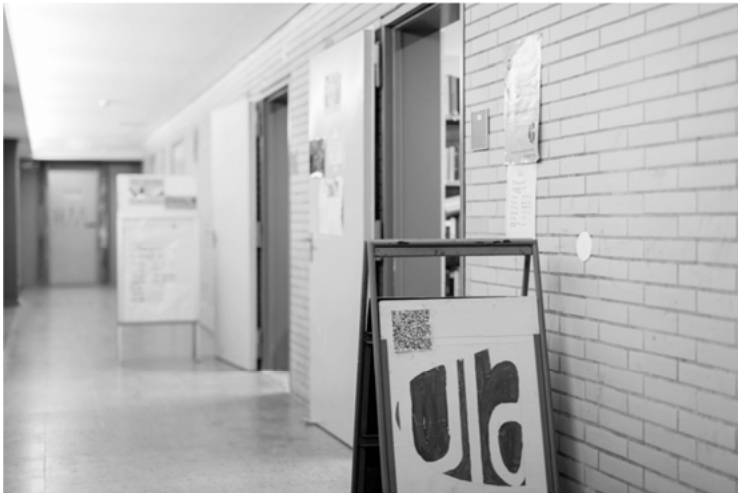
Abbildung 3: Der Eingangsbereich des Ula

nötig vorher etwas mitzubringen oder einen Mitgliedsbeitrag zu bezahlen, um sich etwas nehmen zu dürfen. Jede und jeder ist willkommen. Der Laden selbst wird von einer Handvoll freiwilliger Helfer*innen ehrenamtlich betreut, die sich dem Konzept des Umsonstladens verbunden fühlen. Da die Technische Universität die Räumlichkeiten zur Verfügung stellt, fallen keine Kosten an. Somit ist Ula nicht abhängig von Mitgliedsbeiträgen oder Geldspenden. Da keine Mitgliedsbeiträge gezahlt werden, gibt es aber auch keine Übersicht über die Nutzer*innen – dennoch, ein paar ‚Stammkund*innen‘ gibt es wohl schon.