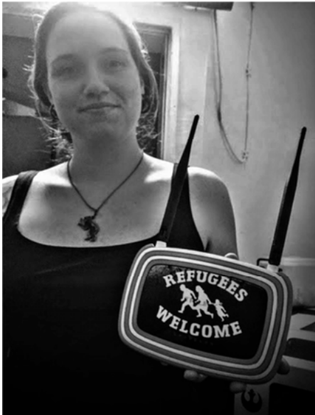
Abbildung 3: Refugees Welcome

Quelle: Faustus Kühnel. Lizenz.CC-BY-NC/4.0