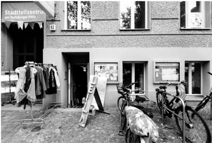
Abbildung 2: Die Außenansicht des Leila

sche und nicht-ökonomische Praktiken aufgelistet werden, um die gelebte Solidarität greifbar zu machen. Der Begriff gelebte Solidarität soll erfassen, inwieweit im Alltag der Gruppierung um Leila solidarisch gehandelt wird, d.h. inwieweit man sich beispielsweise gegenseitig hilft und unterstützt, füreinander einsteht, und gemeinsame Werte und Ziele teilt. Die Solidarität als Lebensform zeigt sich im Leila in verschiedenen Bereichen sowohl als interne Solidarität gegenüber den Mitgliedern, also der Gemeinschaft um Leila, als auch als externe Solidarität gegenüber der Gesellschaft als ganzer, die sich nicht an Leila beteiligt. Die Begriffe interne und externe Solidarität stehen sich hier gegenüber, da sie zwei unterschiedliche Ebenen erfassen, auf die sich das solidarische Handeln der Mitglieder von Leila bezieht.