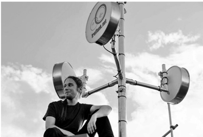
Abbildung 2: Dachinstallation auf dem Deutschen Technikmuseum Berlin

Die vielen Freifunk-Gruppen in Deutschland haben mitunter unterschiedliche Perspektiven auf das, was sie tun und wofür sie stehen – Freifunk im Rheinland hat vielleicht andere Prioritäten als die Ur-Funker Berlins. Der 2003 gegründete Förderverein Freie Netzwerke e.V. stellt für die über 145 lokalen Initiativen (Stand: Januar 2015) eine institutionelle Verhandlungsbasis dar. Freifunk agiert im Sinne der Dezentralität ansonsten als loser Verbund, der – wo es nicht dringend notwendig ist – auf Vereinsstrukturen verzichtet, um Hierarchien weitestgehend zu vermeiden und die Anonymität der Nutzer*innen zu wahren. Um freie Netze betreiben zu können und weil die Gesetzeslage häufig schwammig ist, ist die Initiative schon des Öfteren in rechtliche Grauzonen getrieben worden.