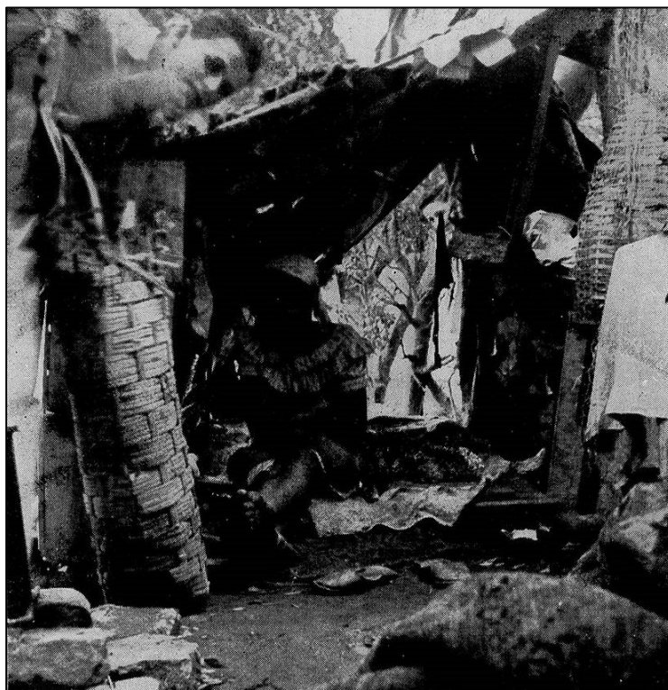
Figura 3 – Fotografias em sequência do cotidiano da favela e classe média (1).