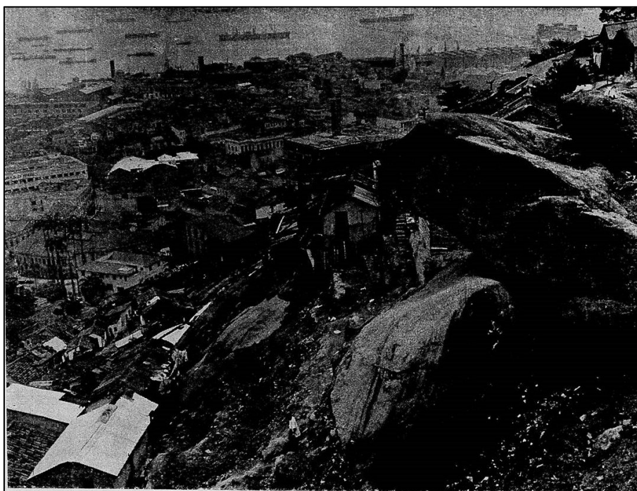
Figura 5 – Morro da Favela.