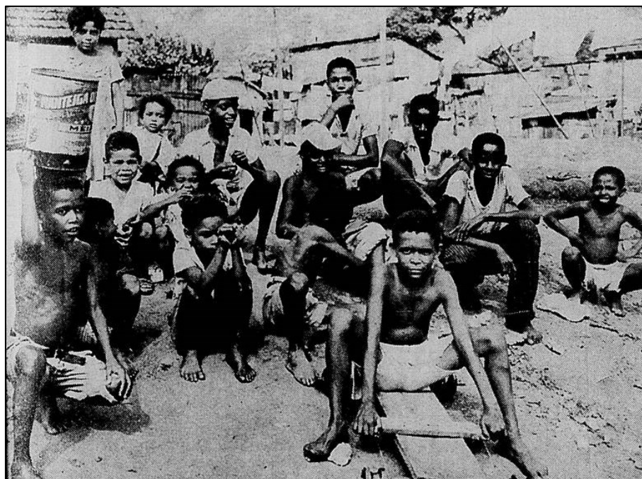
Figura 6 – Fotografia de jovens em uma favela.