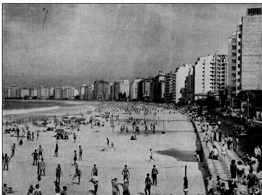
Figura 2 – Fotografia da orla de Copacabana.