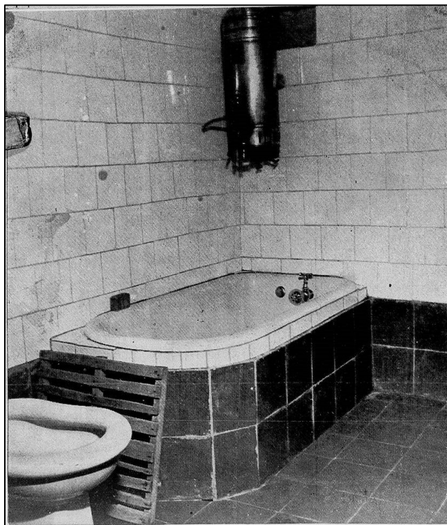
Figura 4 – Fotografias em sequência do cotidiano da favela e classe média (2).