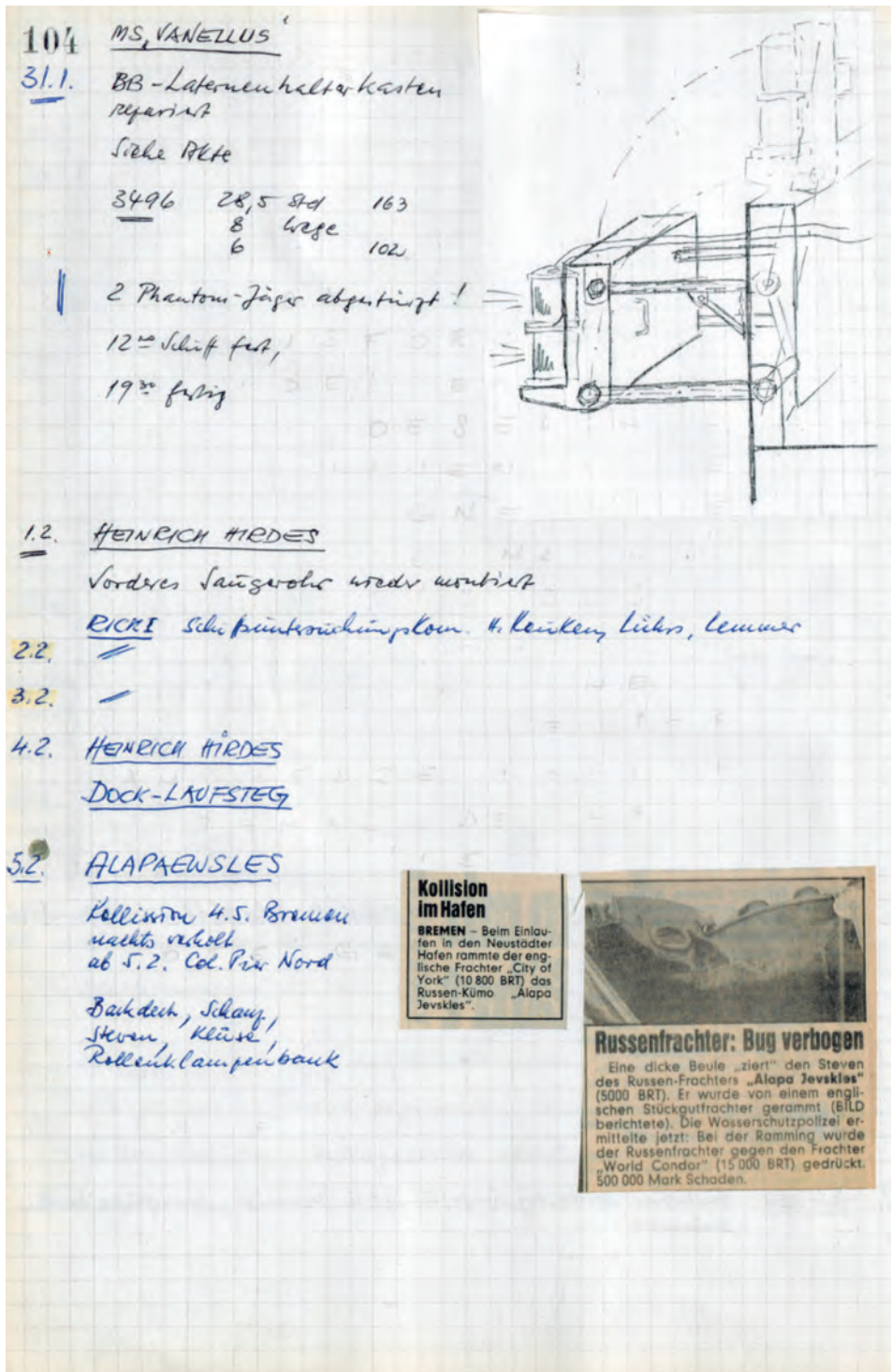
Abb. 5 Auch Zeitungsartikel galten Herbert Pfohl als dokumentarische Belege.