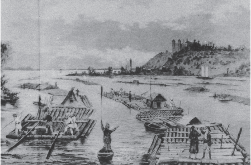
Abb. 3 Der Holzschnitt von J. Felarowski, datiert ca. 1890, zeigt Flöße auf der Weichsel. Im Bild sind unterschiedliche Hüttenformen zu erkennen. In der Bildunterschrift verweist Przemyslaw Smolarek u.a. auf den in einem Boot stehenden Lotsen, der mit dem in der linken Hand hoch gehaltenen Ruder die Flößer darauf hinweist, dass das Wasser auf der linken Flussseite flach ist. (Aus: Przemyslaw Smolarek: Types of Vistula Ships in the 17th and 18th Century. In: Yearbook of the International Association of Transport Museums, vol. 8, 1981, Abb. 56, S. 93)