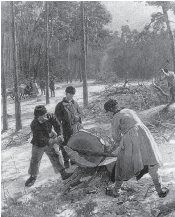
Abb. 8 Foto des Bildes »Waldarbeit in Galizien« aus dem fünfteiligen Gemäldezyklus »Vom Walde bis zur Mühle« aus dem Jahr 1903. (Aus: Irene Eder: Friedrich Kallmorgen 1856–1924. Monographie und Werkverzeichnis der Gemälde und Druckgraphik. Karlsruhe 1991, Abb. G 447)

In den zwei Fotos (Abb. 8–9) sind die zwei letztgenannten Bilder überliefert, beide hochformatig und laut Maßangaben 165 cm hoch und 150 cm breit. Das Bild »Waldarbeit in Galizien« zeigt zwei Waldarbeiter, die mit der Säge das untere Ende eines mächtigen gefällten Baumes be-