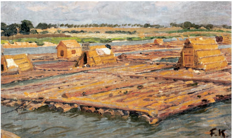
Abb. 1 Das Gemälde »Flöße auf der Weichsel« aus dem Jahr 1901 von Friedrich Kallmorgen. (DSM, Inv.-Nr. I/9995/06)

Das kleine Gemälde entstand laut Werkverzeichnis im Jahr 1901 und zeigt Flöße auf der Weichsel. Menschen, d.h. Flößer, sind auf dem Bild nicht dargestellt; vielmehr wird mit dem Gemälde ein Eindruck von Aussehen und Konstruktion dieser Wasserfahrzeuge vermittelt.