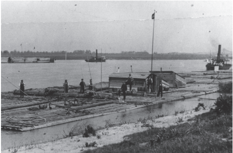
Abb. 4 Ein Rheinflöß mit Floßhütten. Foto um 1920.