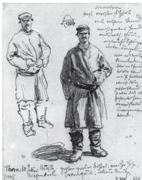
Abb. 6 Bleistiftzeichnung »Russischer Flößer« von Friedrich Kallmorgen, datiert 1901. (Aus: Katalog der Städtischen Galerie im Prinz-Max-Palais Karlsruhe zur Ausstellung »Mit Kallmorgen unterwegs. Zeichnungen und Gemälde von 1880 bis 1920«, 21. Dezember 1991 bis 16. Februar 1992, Katalognummer 122, abgebildet auf S. 158)

Auch wenn Kallmorgen in seinen Tagebuchaufzeichnungen nur erwähnt, dass er das Interieur von Franckes Sägemühle in Karlsdorf bei Bromberg gemalt habe, und nicht von Außendarstellungen dieser Sägemühle spricht, könnte es sich bei der von Eder katalogisierten Arbeit um eine Außenansicht dieser Sägemühle handeln. Eders Hinweis auf einen Fluss vor den Gebäuden und auf die arbeitenden Holzflößer