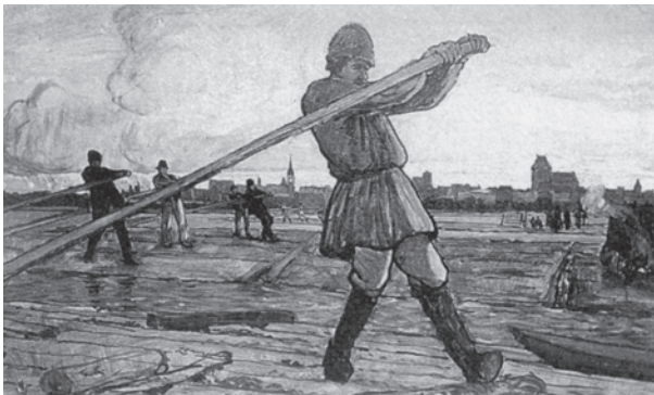
Abb. 7 Das Bild »Flößer auf der Weichsel« von Friedrich Kallmorgen aus dem Jahr 1902 war wohl – wie das Bild »Flöße auf der Weichsel« und die hier als Abb. 5 und 6 wiedergegebenen Bleistiftzeichnungen – Studie für das große Bild »Flößerei auf der Weichsel bei Thorn« des fünfteiligen Gemäldezyklus »Vom Walde bis zur Mühle« aus dem Jahr 1903. (Aus: Irene Eder: Friedrich Kallmorgen 1856–1924. Monographie und Werkverzeichnis der Gemälde und Druckgraphik. Karlsruhe 1991, Abb. G 428)

Über die Bilder aus dem Jahr 1901 hinaus nennt das Werkverzeichnis mit der Nummer G 428 mit dem Entstehungsjahr 1902 ein weiteres Bild »Flößer auf der Weichsel«, das in der Technik Öll/Lwd/Malpappe ausgeführt ist. 24 Das großformatige Werk (Abb. 7), das mit den Maßen 59 cm x 103 cm erheblich größer als die vorher genannten – »Flöße auf der Weichsel« und »Sägewerk« – ist, zeigt im Vordergrund einen Flößer am Floßruder. Er bewegt das Ruder mit beiden Händen vor der Brust. Die Haltung mit dem durch einen Schritt nach vorn durchgestreckten linken Bein, das sich scheinbar auf einem Querholz abdrückt, und dem eingewinkel-