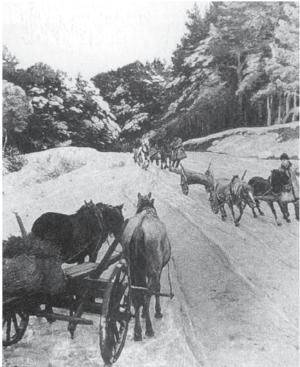
Abb. 9 Foto des Bildes »Holzfuhren an der Weichsel« aus dem fünfteiligen Gemäldezyklus »Vom Walde bis zur Mühle« aus dem Jahr 1903. (Aus: Irene Eder: Friedrich Kallmorgen 1856–1924. Monographie und Werkverzeichnis der Gemälde und Druckgraphik. Karlsruhe 1991, Abb. G 448)

Eine nähere Betrachtung und der Vergleich mit einer Beschreibung der Arbeit der Weichselflößer durch Ebner erschließen Details dieser Tätigkeit und des Lebens der Weichselflößer: Jede Traft (Abb. 95) [hier: Abb. 2] besitzt sieben bis acht Ruder,