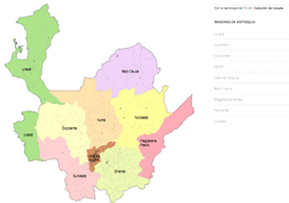
Ilustración 2. Distribución en subregiones de Antioquia.

Adicionalmente, con el fin de establecer una “mejor coordinación institucional” en la gestión pública se ha propuesto organizar el Departamento en nueve subregiones: bajo cauca, Magdalena Medio, Nordeste, Norte, Occidente, Oriente, Suroeste, Urabá y Valle de Aburrá. En la siguiente ilustración se muestra su distribución: