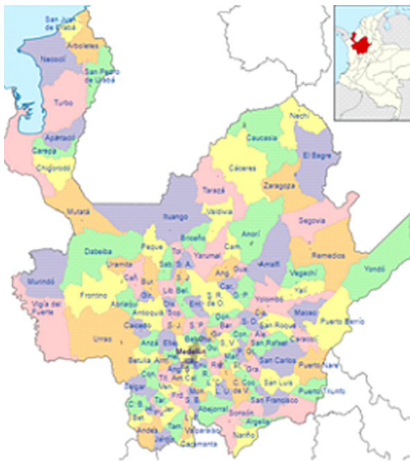
Ilustración 1. Distribución político-administrativa de Antioquia.

Adicionalmente, con el fin de establecer una “mejor coordinación institucional” en la gestión pública se ha propuesto organizar el Departamento en nueve subregiones: bajo cauca, Magdalena Medio, Nordeste, Norte, Occidente, Oriente, Suroeste, Urabá y Valle de Aburrá. En la siguiente ilustración se muestra su distribución: