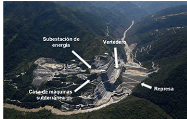
Ilustración 5. Ilustración gráfica del proyecto.

Para lograrlo se proponía realizar obras de desviación temporal de río Cauca, en la margen derecha, consistentes en dos túneles que se taponarán una vez construida la presa; el vertedero para evacuación de crecientes, del tipo canal abierto, controlado por cinco compuertas, y el túnel de descarga intermedia, para control del llenado del embalse y garantizar, en cualquier evento, la descarga hacia aguas abajo de la presa, de un caudal mínimo exigido por la autoridad ambiental, de 21 m 3 /s.