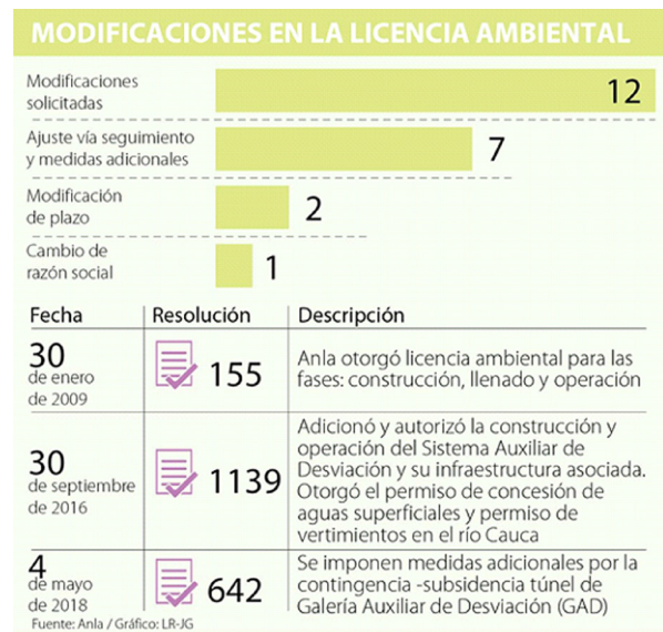
Ilustración 6. Resumen de las modificaciones a la licencia ambiental. (La República, 2018)

Otro punto a analizar es que el proyecto Hidroituango obedece a decisiones políticas por encima de las técnicas, comportamiento típico de la plutocracia, es decir, que el poder se ejerce desde los más ricos o muy influido por ellos. Para muestra es que la licencia ambiental tiene 22 modificaciones tal como se resume el siguiente infográfico: