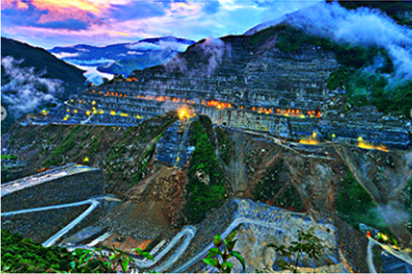
Ilustración 4. Vista del proyecto.

Gracias a la “visión” futurista, de empresarios antioqueños, Empresas Públicas de Medellín y la Gobernación de Antioquia (a través del IDEA) se lideró un megaproyecto tal como lo es la hidroeléctrica HidroItuango, la cual está conformado por una presa de 225 m de altura y 20 millones de m 3 de volumen, y una central subterránea de 2.400 MW de capacidad instalada y 13.930 GWh de energía media anual.